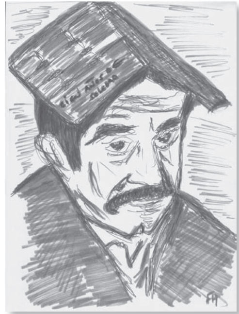
Caricatura a rotulador de Gabriel García Márquez