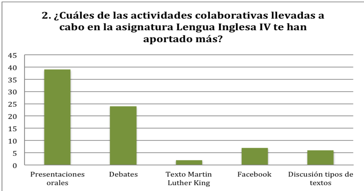
Gráfica 1. Actividades colaborativas llevadas a cabo en el aula.

La gran mayoría del alumnado encuestado votó por las presentaciones orales (39); un poco más de la mitad se decantó al mismo tiempo por los debates (24); 7 eligieron la participación en Facebook y 6 la discusión de las clasificaciones de tipos de textos. Por último, tan sólo 2 eligieron la preparación del texto de Martin Luther King por grupos.