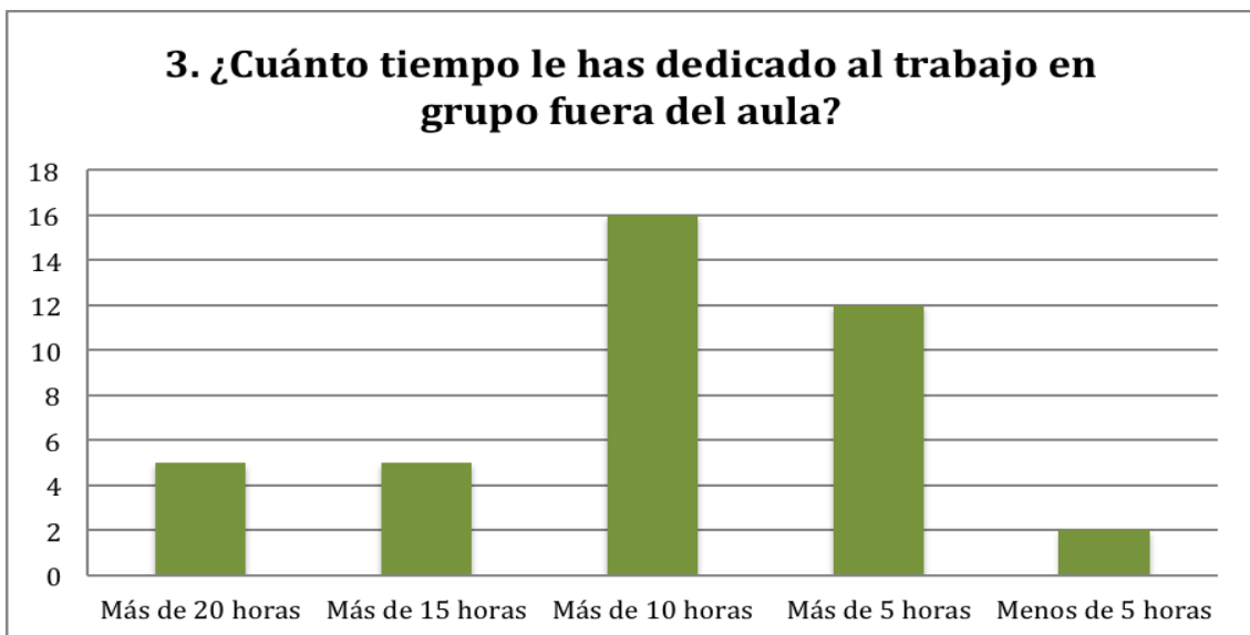
Gráfica 2. Dedicación en horas al trabajo en grupo fuera del aula.

Una de las contrariedades más comunes del trabajo colaborativo es la dedicación y la inversión de tiempo que conlleva. Así pues, se consideró oportuno incluir una pregunta en la que se preguntara acerca del número de horas aproximado que se dedicó al trabajo en grupo fuera del aula en las tareas señaladas.