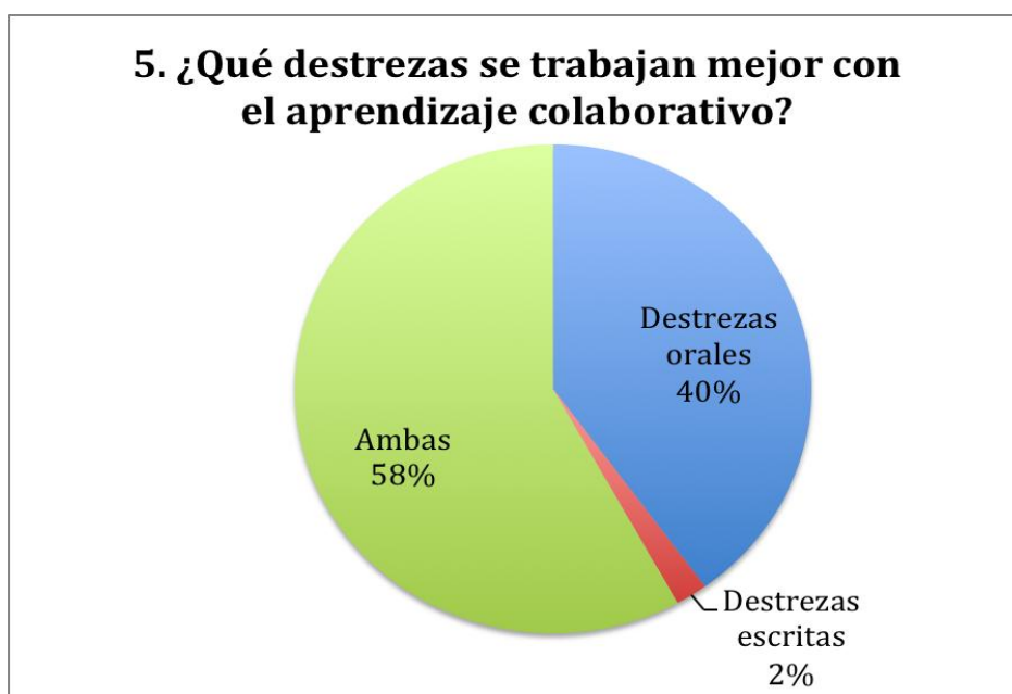
Gráfica 3. Las destrezas y el aprendizaje colaborativo.

La siguiente pregunta se centra en las destrezas. De este modo, se pregunta al alumnado qué destrezas considera que se trabajan mejor con el método de aprendizaje colaborativo (ver la gráfica 3); un 58% considera que el aprendizaje colaborativo es adecuado para trabajar tanto las destrezas orales como las escritas, mientras que un 40% de los encuestados se inclinan por las destrezas orales exclusivamente. Finalmente, sólo un 2% eligió las destrezas escritas exclusivamente.