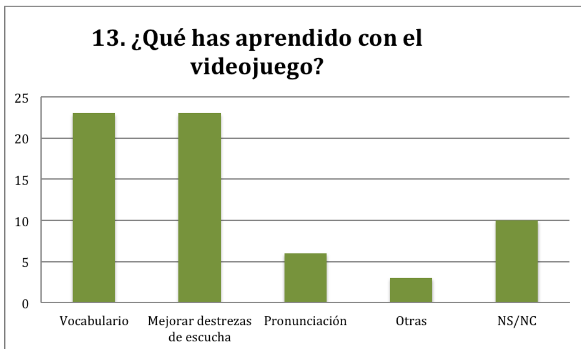
Gráfica 5. Aprendizaje derivado del uso del videojuego.

Cabe mencionar también que se incluyeron tres preguntas con respecto a un videojuego creado por un profesor del departamento. En general, y debido a su carácter lúdico, la gente lo acogió con agrado, pues lo consideraron original, pero presentaba bastantes problemas a la hora de jugar, ya que se trataba de un videojuego recientemente diseñado y, por consiguiente, con algunos aspectos pendientes de mejorar. Se les pedía a los alumnos que pudieron jugar, aunque sólo fuera momentáneamente, que marcaran qué aspectos aprendieron con el manejo del videojuego, de entre los siguientes (obviamente podían elegir más de una opción): a) vocabulario; b) mejorar las destrezas de escucha; c) pronunciación; y d) otras. Estos fueron los resultados: