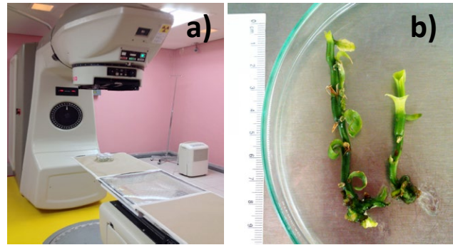
Foto 2. Mutagénesis en V. planifolia a) Unidad Gamma Cell del Centro Estatal de Cancerología b) Variación en el tamaño de brotes de V. planifolia tratada con 25 mgL -1 de colchicina, en relación al tratamiento control.

Se está trabajando en la caracterización morfoagronómica y molecular de dicho germoplasma con el fin de establecer una base de datos de utilidad para los mejoradores de este cultivo. Con el análisis integral de los datos obtenidos se espera contribuir a la selección de fuentes parentales, para su empleo en los programas de hibridación y para evaluar si los niveles de variación molecular presentes en los sitios contrastantes en cuanto a caída de frutos, se encuentra asociado con esta seria problemática productiva. Por ello y con el fin de contribuir a incrementar la base genética en este cultivo, con propósito de mejoramiento, se están desarrollando diversos protocolos de cultivo de tejido encaminados a explotar la variación somaclonal. En este aspecto, se logró establecer un protocolo de organogénesis indirecta que permitió la obtención de suspensiones celulares, cuya viabilidad y dinámica se está estudiando. La variación somaclonal generada se está potenciando con el empleo de mutágenos químicos (azida de sodio (NaN 3 ), sulfato de dimetilo y colchicina) y el uso de bajas dosis de radiaciones ionizantes (radiaciones gamma y acelerador de partículas) con el apoyo de la Unidad Gamma Cell del Centro Estatal de Cancerología (Foto 2a), donde se están aplicando diversas dosis de radiaciones gamma a brotes de V. planifolia en fase de multiplicación. Los brotes sometidos tanto a radiaciones ionizantes como a mutágenos químicos han mostrado variación (Foto 2b).