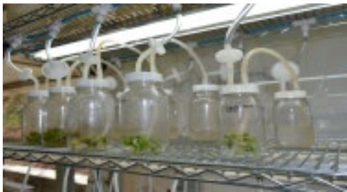
Foto 3. Sistema de Inmersión Temporal empleado en la micropropagación de V. planifolia

Los materiales genéticos promisorios que se están ya seleccionando se micropropagarán para su evaluación en campo, con la participación de los productores. Para ello, se ha estado trabajando para establecer un método efectivo para la multiplicación rápida de genotipos promisorios mediante diferentes sistemas: el Recipiente de Inmersión Temporal Automatizado (RITA), el Bioreactor de Inmersión Temporal (BIT) y el Bioreactor de Inmersión por Gravedad (BIG) (Bello e Iglesias, 2012).