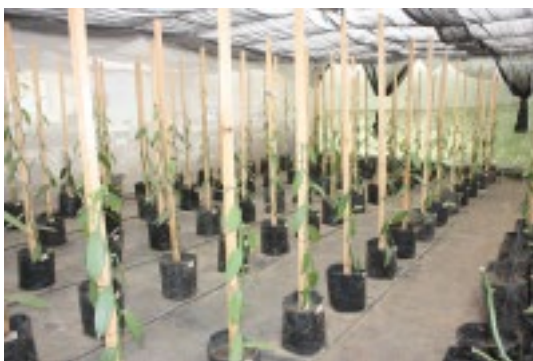
Foto 5. Evaluación de enmiendas orgánicas y lombrices de tierra para incrementar el crecimiento y productividad de vainilla ( V. planifolia ) bajo invernadero

Los estudios que se están llevando a cabo permitirán, de igual forma, desarrollar paquetes tecnológicos que contribuyan a manejar la actividad biológica de las lombrices nativas, con la biomasa y los recursos orgánicos óptimos, a fin de que puedan incrementar significativamente la fertilidad del suelo y la productividad de este cultivo. Actualmente, se evalúa la influencia de la actividad de las lombrices de tierra y los abonos verdes en el crecimiento y productividad de vainilla (Foto 5).