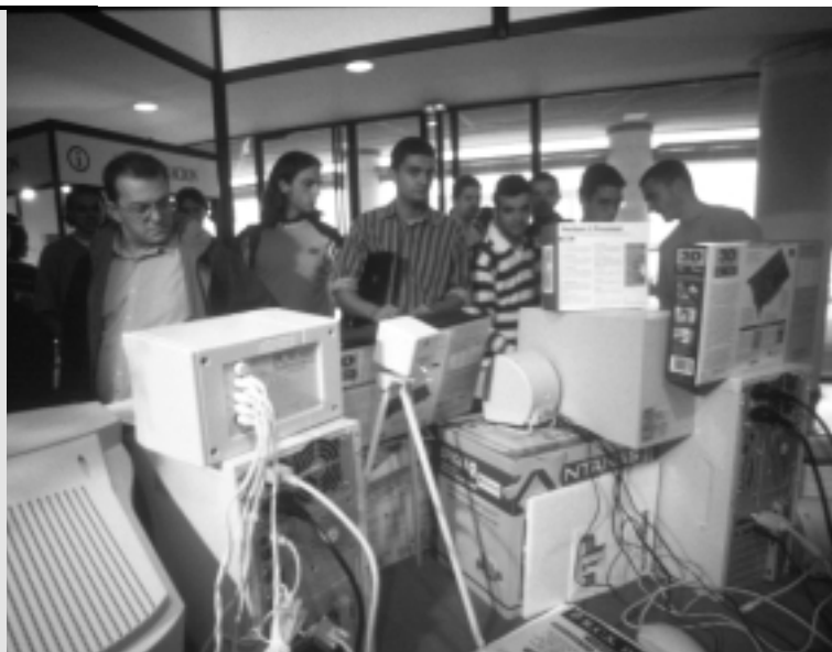
Feria de la SETAI

Este encuentro incluyó una feria montada en el Aulario II en la que participaron ocho empresas del sector que expusieron sus productos más novedosos. Las conferencias trataron sobre Internet (“Cable-módem” y “Más allá del año 2000”), los informáticos del próximo futuro el efecto 2000 y el euro.