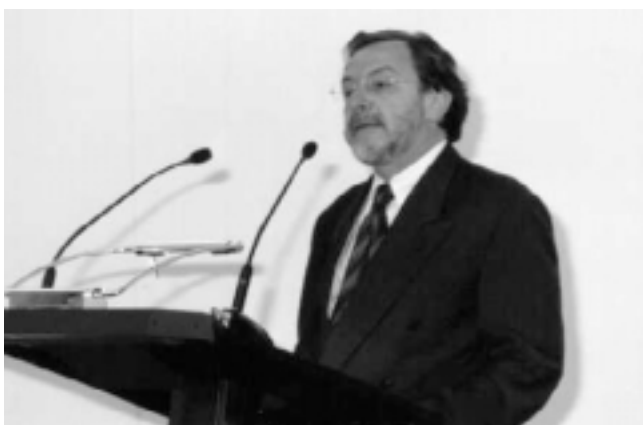
Juan Luis Cebrián durante la inauguración de la biblioteca

El escritor y periodista Vicente Verdú cerró el acto con una disertación en clave de humor acerca de los múltiples obstáculos con los que se topaba cualquier lector cuando quería penetrar en las bibliotecas de antaño como contrapunto a la facilidad y la universalidad del acceso a la biblioteca virtual.