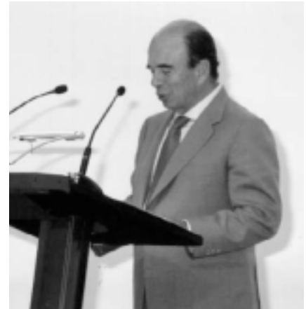
Acto de inauguración de la biblioteca virtual. Arriba, Emilio Botín durante su intervención