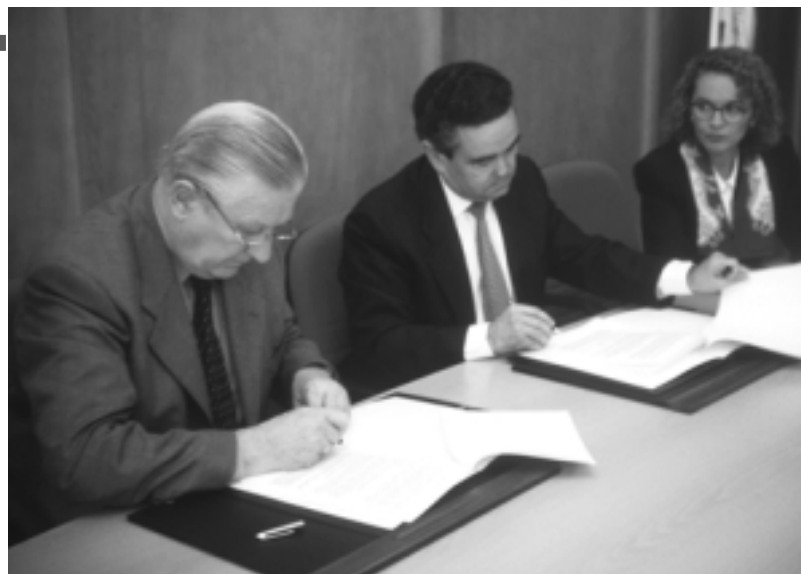
El presidente de la Televisión Educativa Iberoamericana firma el convenio con el rector de la U.A.

Ambas instituciones se asesorarán mutuamente para la digitalización de textos de interés común y se piensa crear un portal específico que recogería las obras de un catálogo conjunto de filosofía española a partir de textos ya digitalizados de ambas entidades y los que se acometan en el futuro, coordinando esfuerzos y apoyando un extenso y significativo patrimonio bibliográfico en la red.