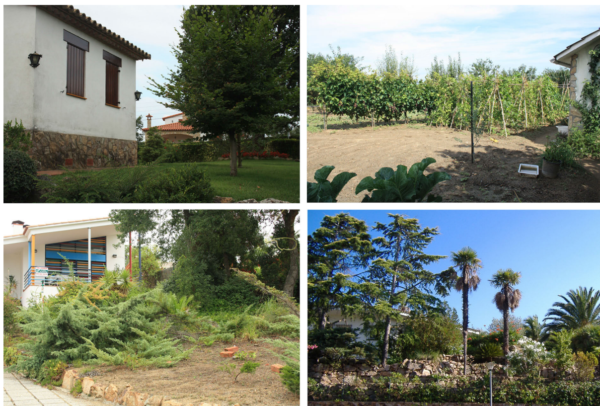
Figura 2. Ejemplos de jardín césped (parte superior izquierda), huerto (parte superior derecha), ornamental (parte inferior izquierda) y arbolado (parte inferior derecha).