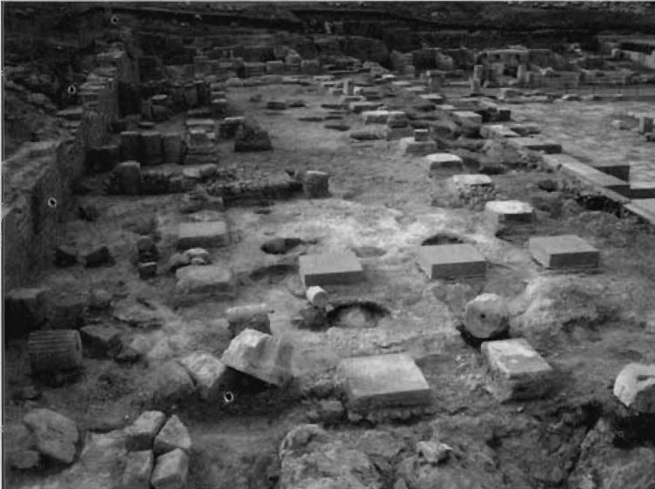
Fig. 7.- Vista general de la basílica desde el norte al término de su excavación en septiembre de 2005.

La basílica se construyó en el costado oriental del foro y su excavación se ha llevado a cabo entre los años 2004 y 2005. Se trata de un edificio de tres naves separadas por dos perístasis de 12 columnas de orden corintio. Las naves laterales tienen una anchura de 3,60 m y la central presenta 7,24 m de amplitud. Las cabeceras norte y sur estaban rematadas por sendos edículos sobreelevados, a los que se accedía por tres tramos de escalera, de tres peldaños cada uno, que se han conservado en el aedes meridional. (fig. 7).