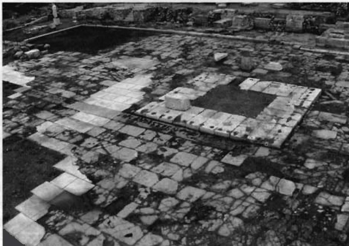
Fig. 2.- Monumento cuadrado situado en el centro de la plaza forense y huellas de la inscripción con litterae aureae .

En el centro de la plaza forense se situó un monumento cuadrado y escalonado, coronado por un conjunto escultórico y cuatro pedestales de estatua en las esquinas. De él sólo queda la primera hilada de sillería y las huellas de apoyo de la segunda y tiene unas dimensiones de 7,48 x 7,80 m. Todo el monumento estuvo rodeado por una barandilla de metal, anclada con espigas de bronce y hierro. Su colocación se produjo en una reforma posterior del recinto, pero en la elección del lugar a ocupar tuvo mucho que ver la presencia de la inscripción con letras de bronce de época augustea que recordaba que un tal Spantamicus había pagado con su dinero el enlosado del foro (fig. 2).