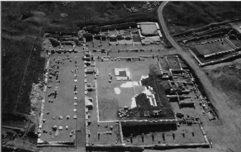
Fig. 1.- Vista aérea del foro de Segobriga tomada en febrero de 2006.

Los testimonios epigráficos evidencian que el foro de Segobriga era ya una realidad arquitectónica en el año 15 aC. Este espacio fue tomando forma a lo largo de las décadas siguientes con la planificación y construcción de una basílica, una curia, un edificio con exedra y una serie de tabernae situadas en el costado meridional de la plaza forense (fig. 1).