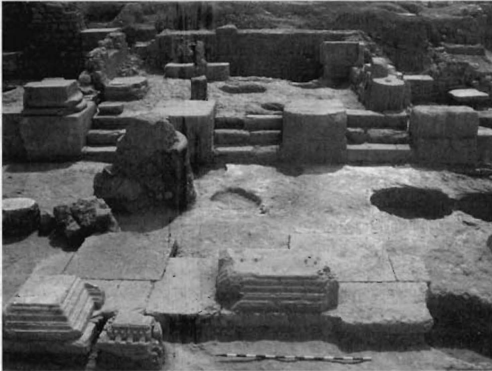
Fig. 9.- Vista general del aedes meridional de la basílica desde el norte. Al fondo podio en forma de P.