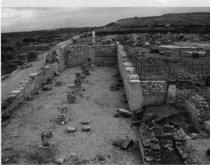
Fig. 5.- Criptopórtico septentrional del foro visto desde el oeste.

madas por un aparejo mixto que combina pilares de opus quadratum , de anchura variable, con paños de opus vitatum forrando un núcleo de opus caementicium y con las esquinas reforzadas con sillares (fig. 5).