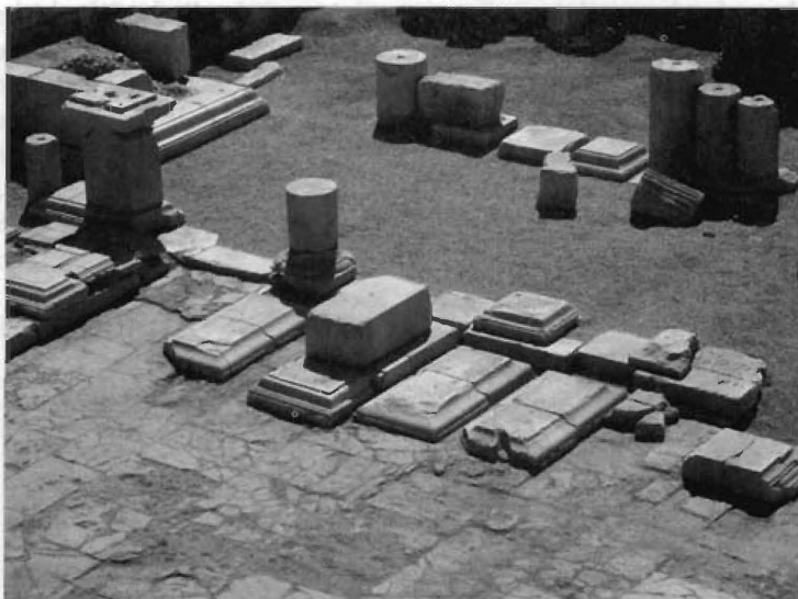
Fig. 4.- Zócalos de pedestales ecuestres situados en el ángulo suroriental de la plaza del foro.

En la propia plaza conocemos la existencia de 12 huellas de pedestales, siete de las cuales corresponden a estatuas ecuestres. La necesidad de cincelar la superficie del enlosado sobre la que iban a situarse, con la finalidad de que la argamasa empleada para su colocación trabara con las losas, ha permitido conocer su existencia. Su disposición, que sigue aparentemente cierto orden, parece indicar que el espacio ocupado por un pedestal no fue reocupado por otro colocado con posterioridad y tampoco parece que hubiera obstáculos para la contemplación o lectura de las inscripciones 5 .