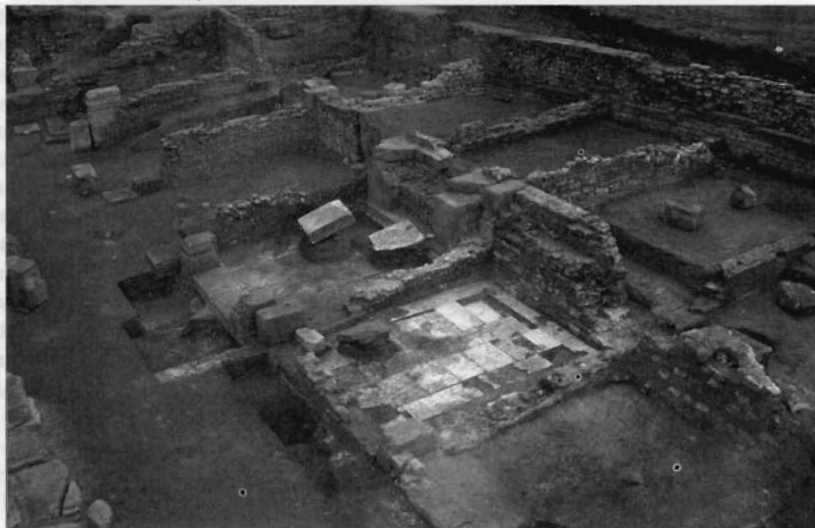
Fig. 11.- Vista general de las tabernae del foro de Segobriga.

En el extremo meridional del conjunto forense se descubrieron el año 2003 siete tabernae a las que se accedía desde el pórtico meridional y que formaron parte de una ampliación de época flavia, tal y como se desprende de los materiales cerámicos hallados en sus zanjas de cimentación. En todas las ocasiones se trata de simples tabernae , con la excepción de la central que nunca debió tener tal uso. (fig. 11).