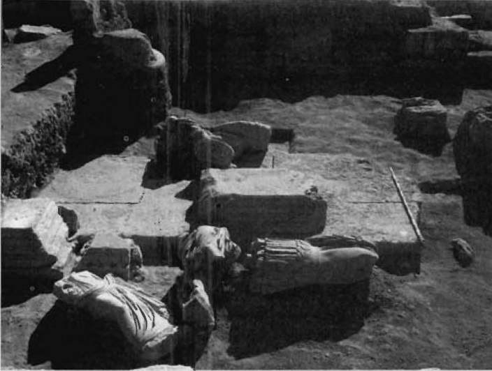
Fig. 8.- Conjunto escultórico hallado en torno al podio del extremo sur de la nave central del forode Segobriga. 16 de noviembre de 2004.

situado en el interior del aedes meridional. Para su colocación fue necesario retallar el zócalo moldurado del monumento para adaptarse a la forma de las columnas situadas en el cierre de la perístasis (fig. 8 y 9).