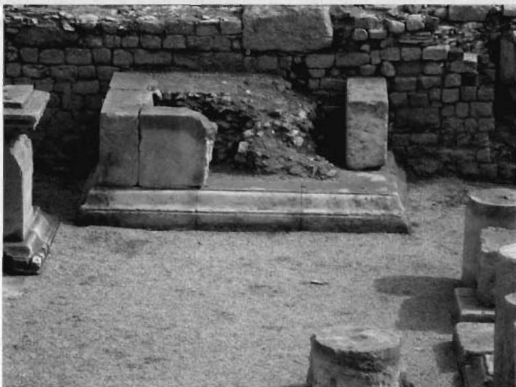
Fig. 6.- Altar consagrado a Augusto en el extremo oriental del pórtico sur del foro de Segóbriga .

El pórtico meridional del foro de Segóbriga estuvo presidido por un altar dedicado a Augusto entre los años 2 aC y 14 dC y que fue colocado en el extremo oriental de este pórtico (fig. 6). Su presencia provocó la colocación de un buen número de pedestales honoríficos. Uno de ellos se conserva in situ en su ubicación original y con todos sus elementos. Se corresponde con un monumento erigido en honor de los hermanos Calventia Titulla y C. Calventius Pudens , miembros de una de las familias importantes de la ciudad, que fue erigido en época flavia.