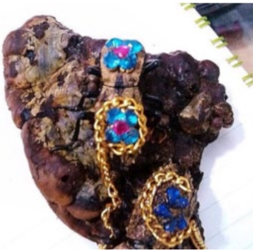
Fig. 1B.- Decoración actual de Z. chilensis para su venta al público en el mercado de artesanías de la ciudad de Mérida, Yucatán

Geográficamente, el escarabajo Z. chilensis se distribuye desde Estados Unidos de América, hasta el centro y sur del continente americano (Venezuela y Colombia) (Triplehorn, 1972). Son insectos saproxílicos es decir, su desarrollo depende de los procesos de descomposición de la materia orgánica que se dan en diversos micro hábitats de los árboles vivos, y muertos (Speight, 1989; Alexander, 2008). El tipo de micro hábitats en los que los ejemplares adultos de Z. chilensis suelen ser encontrados es en el interior de cavidades y resquicios de los troncos (Miss-Dominguez et al., 2013) dentro del sotobosque de selvas bajas caducifolias (Fig. 1C), cuya composición vegetal característica son generalmente árboles de Acacia pennatula (Schlech & Benth),