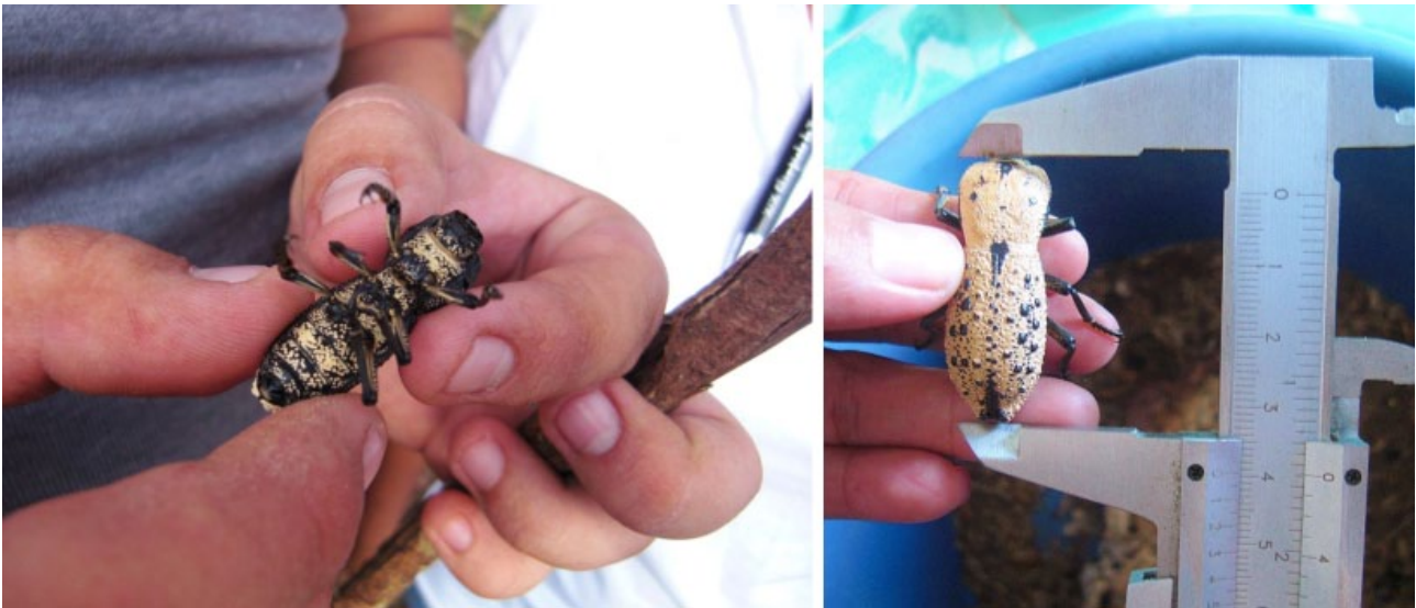
Fig. 4.-Los escarabajos “Maquech” adultos son colectados manualmente, vivos se colocan en un cubo junto con restos de materia orgánica de donde fueron encontrados.

Actualmente tanto la recolección como la venta de Z. chilensis son actividades que no se encuentran reguladas por las autoridades nacionales (NOM-059-SEMARNAT-2010), situación que implica la extracción de los recursos sin conocer el estado de vulnerabilidad de especies como Z. chilensis (Miss-Domínguez, et al. , 2011).