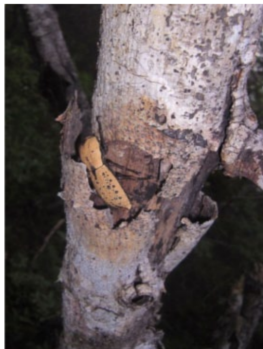
Fig. 1C.- Adulto de Z. chilensis bajo la corteza de un árbol vivo de Acacia pennatula en marzo del 2010

La leyenda de la maldición de Ek'Kan , el guerrero enamorado cobra vida en la utilización de escarabajos “Maquesch” que una vez decorados, se utilizan como broches sobrepuestos en la ropa, como simple adorno o como amuleto.