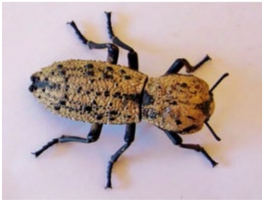
Fig. 1.- Escarabajo adulto de Z. chilensis