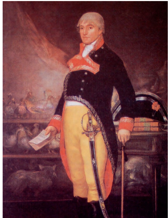
Félix de Azara retratado por Goya (Colección Ibercaja)

Esta breve disquisición terminológica viene al caso cuando se pretende hablar de un hombre que fue un naturalista en el sentido más genuino del término. La figura de Félix de Azara encarna a la perfección la del naturalista ilustrado del XVIII, incluida la faceta de “científico aficionado” que, sin ningún conocimiento previo, tuvo la osadía intelectual de enfrentarse al estudio y descripción de buena parte de la fauna vertebrada (aves y cuadrúpedos) de la América meridional, desde Paraguay al Río de la Plata, y realizar un gran trabajo.