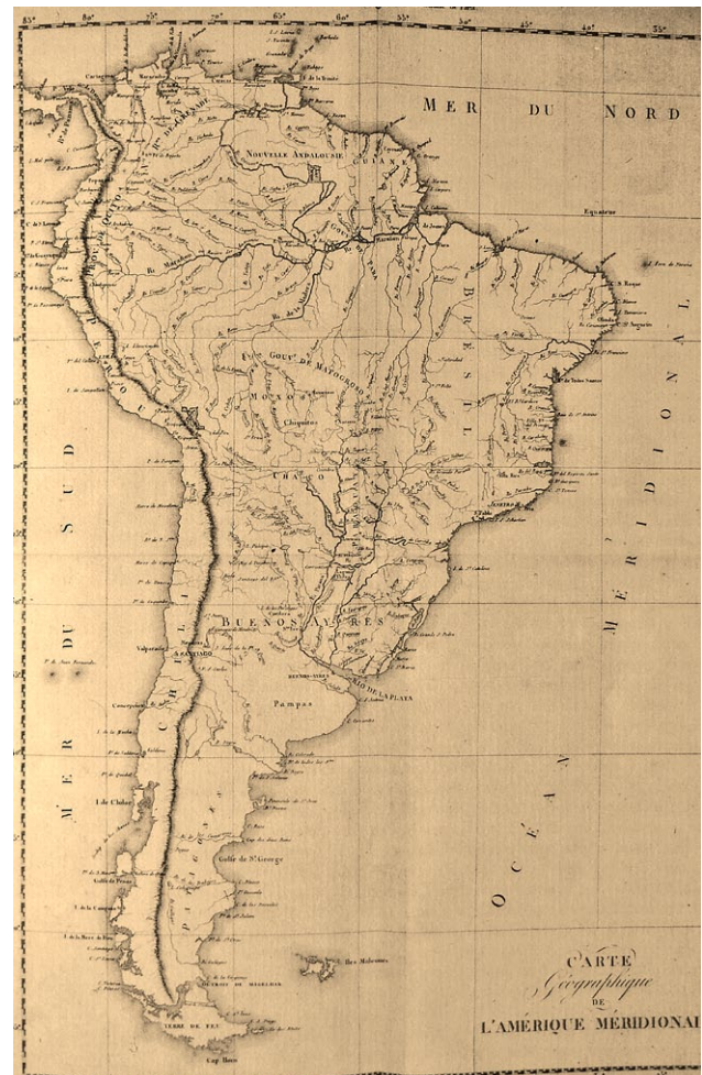
Mapa de la América Meridional. Fuente: Apuntamientos para la Historia Natural de los Pájaros del Paraguay y del Río de la Plata . Edición de Joaquín Fernández Pérez. Ejemplar N° 1554.

Se busca entonces sitio para acampar, generalmente a orillas de una laguna o riachuelo, dispersándose los hombres en procura de leña para hacer fuego y carnear las vacas necesarias para alimentar a los miembros de la expedición, tomándolas bien de las cimarronas o de las pertenecientes a las estancias de las cercanías; a falta de estas mataban a las que llevaban a retaguardia, cuando no tatuejos o armadillos que encontraban en los campos de las inmediaciones. Cuando atravesaban regiones carentes de ganado, ni los llevaban en retaguardia por falta de pastos, preparaban de antemano carne de vaca cortada en lonjas y secada al sol, que luego se comía asada.