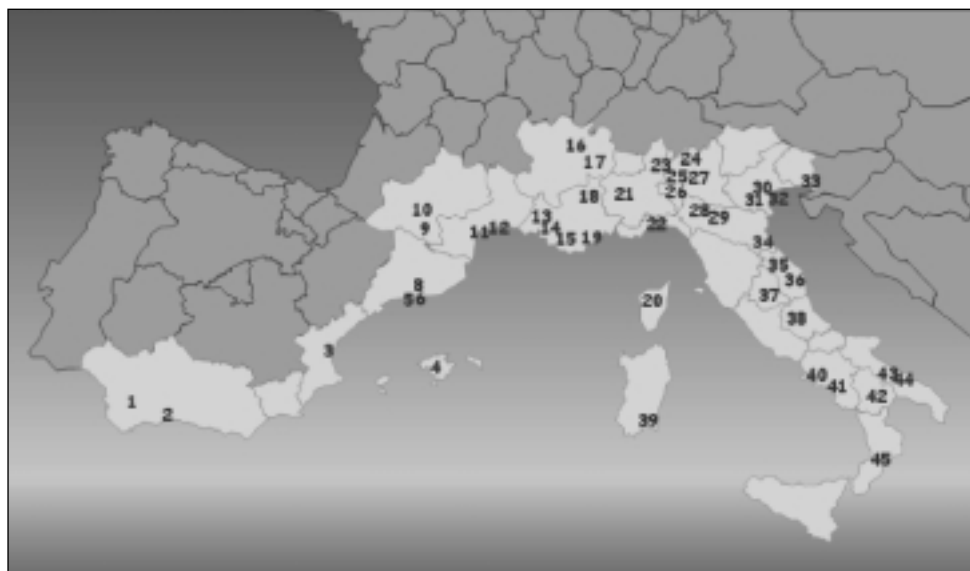
FIGURA 1. Localización de los PCyT en el mediterráneo latino.