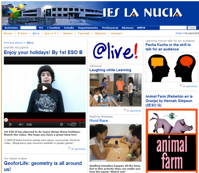
Figura 1: Portada principal d'@live