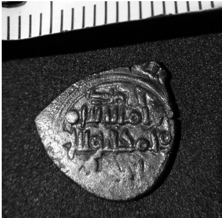
Fig. 4a. Anverso de la moneda andalusí hallada en la excavación.