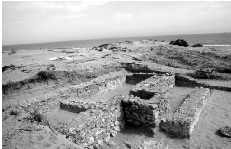
Fig. 3. Vista desde el Oeste del oratorio de época islámica junto el mar Mediterráneo. Obsérvese el mihrāb y el muro de la qibla superpuestos sobre las estructuras de la segunda fase de época tardorromana.