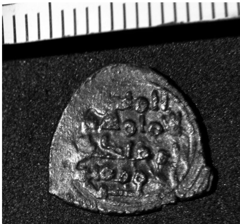
Fig. 4r. Reverso de la moneda andalusí hallada en la excavación.