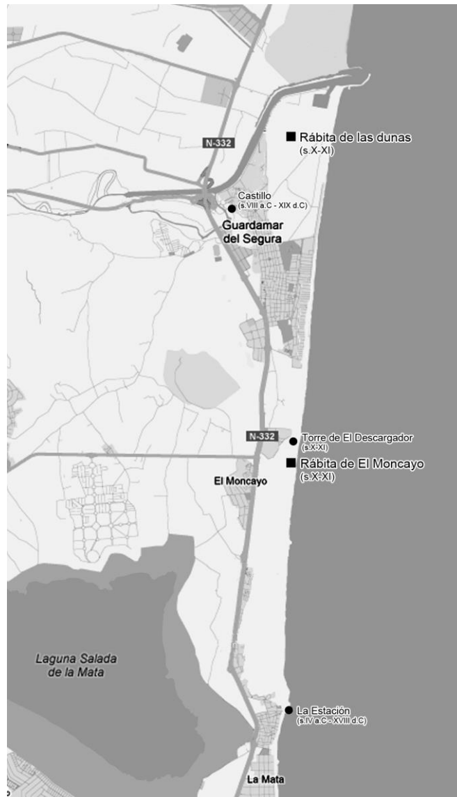
Fig. 1. Mapa con indicación del yacimiento de la Rábita de El Moncayo en la franja litoral de Guardamar del Segura y el poblamiento islámico del entorno.