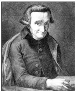
Grabado del Abate Molina, siglo XIX

1 El Papa Paulo III a través de la Bula Sublimis Dei en el año 1537 reconoció la humanidad del «indio».