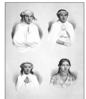
Grabado mujeres mapuches, Dumont d'Urville, 1842