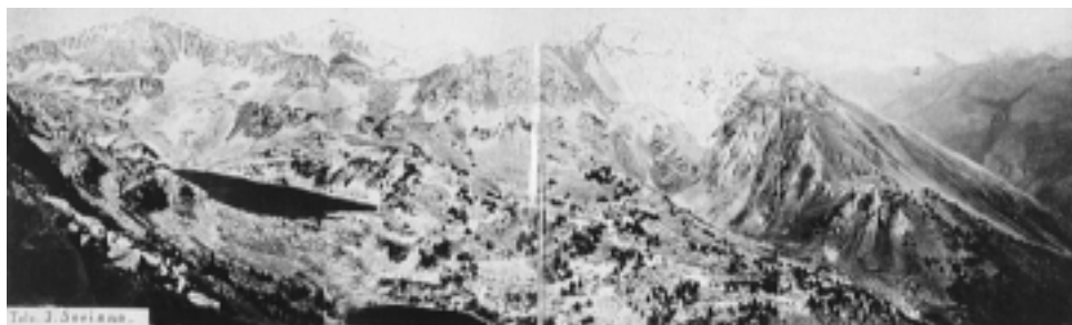
FIGURA 3. Fotograma panorámico del macizo de Beret y lago de Airoto (Lérida) obtenido por el ingeniero geógrafo José Soriano Viguera en la campaña de 1928 en el Pirineo Central. En SORIANO, (1929: 152-153). Biblioteca de Catalunya (Barcelona).

Hasta el año 1933 estas brigadas realizaron levantamientos en los Pirineos Centrales (ver figura 3), en las estribaciones del Sistema Ibérico (provincias de Cuenca, Guadalajara