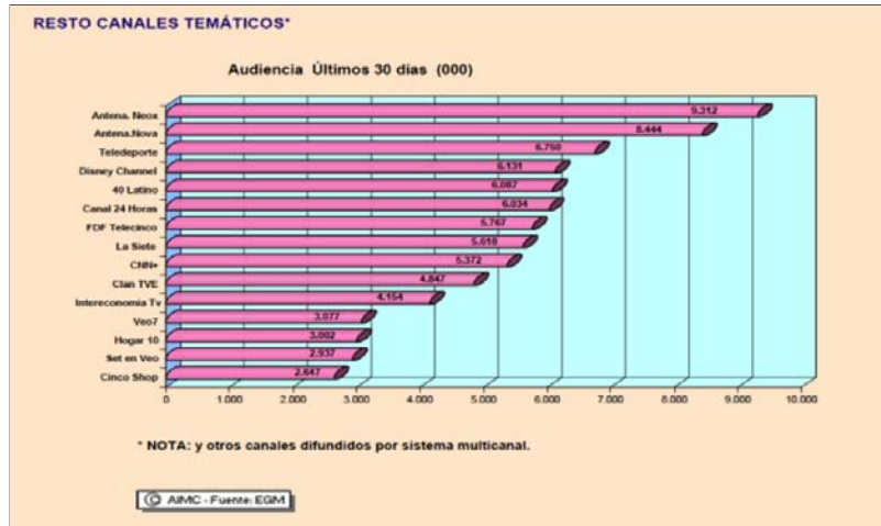
Tabla 1: Audiencia de los canales temáticos, según el Estudio General de Medios.

La selección de la muestra de conveniencia agrupó a todos los anunciantes considerados por Infoad dentro del sector «deportes y tiempo libre» que comprende 15 anunciantes de productos y servicios tradicionalmente considerados infantiles, como juguetes, centros de distribución de productos infantiles y parques de ocio, además de la autopromoción de otras cadenas de televisión. El total de anuncios analizados es de 184. Se ha elegido la cadena temática infantil Disney Channel porque Kantar Media la identificaba como líder de audiencia de la televisión en abierto durante el mes de noviembre de 2009 en España. El mes