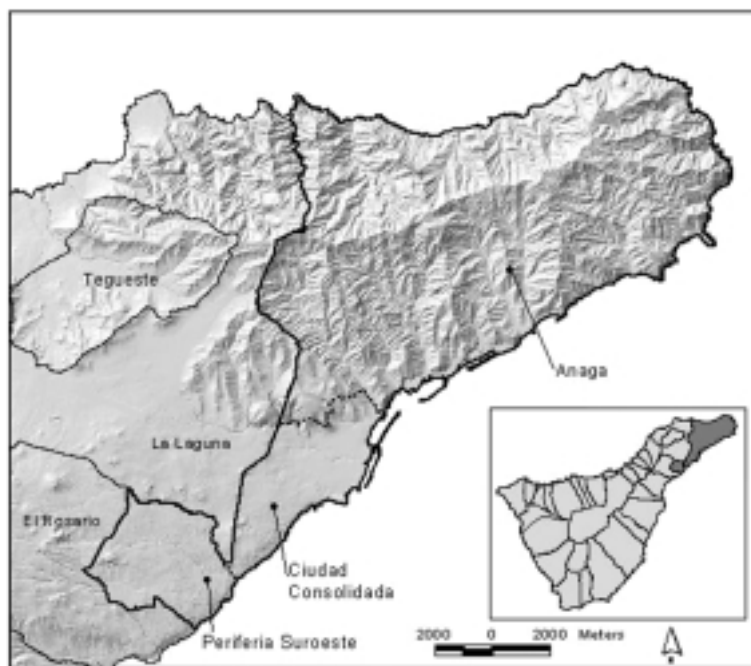
FIGURA 1. Localización de la ciudad de Santa Cruz de Tenerife y de sus unidades residenciales.

Al pie del macizo de Anaga se extiende la CIUDAD CONSOLIDADA, un conjunto urbano de continua y compacta trama, que incluye desde los espacios más valorados y emblemáticos de la ciudad tradicional y el ensanche, hasta los barrios obreros de la primera periferia surgidos a partir de la expansión urbana de mediados del siglo XX. Ese ámbito acoge, en unos 16 km 2 de extensión, a más de 165.000 habitantes (el 81% de la población del término), alcanzando en promedio densidades superiores a los 10.000 por km 2 . Dada la amalgama de