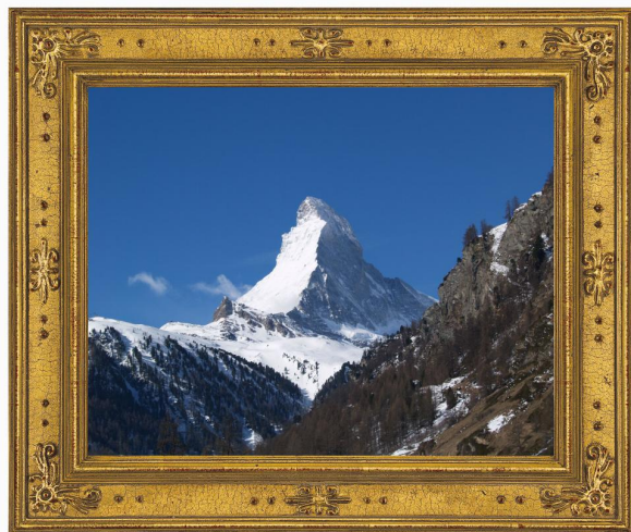
Figura 5: Ejemplo de dos imágenes combinadas