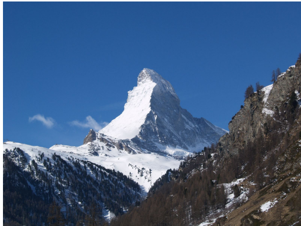
Figura 4: Ejemplo de dos imágenes combinadas