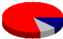
Figura 2: Ejemplo de imagen creada con GD

$darkgray = imagecolorallocate($image, 0x90, 0x90, 0x90); $navy = imagecolorallocate($image, 0x00, 0x00, 0x80); $darknavy = imagecolorallocate($image, 0x00, 0x00, 0x50); $red = imagecolorallocate($image, 0xFF, 0x00, 0x00); $darkred = imagecolorallocate($image, 0x90, 0x00, 0x00); // Rellena la imagen de blanco imagefill($image, 0, 0, $white); // Dibuja unos arcos con efecto 3D for ($i = 60; $i > 50; $i--) { imagefilledarc($image, 50, $i, 100, 50, 0, 45, $darknavy, IMG_ARC_PIE); imagefilledarc($image, 50, $i, 100, 50, 45, 75, $darkgray, IMG_ARC_PIE); imagefilledarc($image, 50, $i, 100, 50, 75, 360, $darkred, IMG_ARC_PIE); } imagefilledarc($image, 50, 50, 100, 50, 0, 45, $navy, IMG_ARC_PIE); imagefilledarc($image, 50, 50, 100, 50, 45, 75, $gray, IMG_ARC_PIE); imagefilledarc($image, 50, 50, 100, 50, 75, 360, $red, IMG_ARC_PIE); // Vuelca la imagen en la salida estándar header('Content-type: image/png'); imagepng($image); // Libera los recursos utilizados imagedestroy($image); ?>