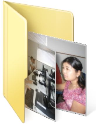
Figura 1: Ejemplo de carátula de álbum