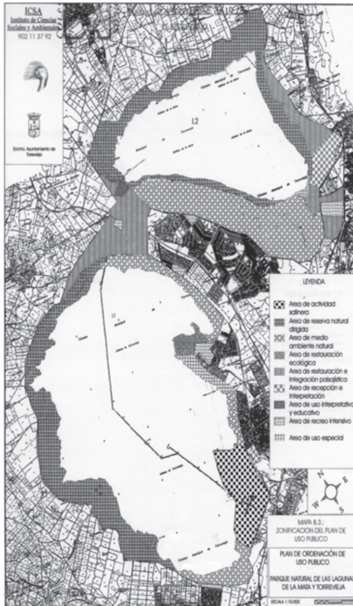
MAPA Nº 4: Zonificación propuesta en el POUP.