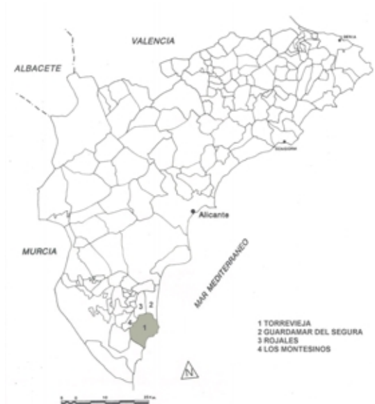
MAPA Nº 1: Localización de la zona de estudio.

modelo de desarrollo turístico desde las premisas de su sostenibilidad, y emprender acciones dirigidas a incorporar nuevos elementos a la oferta, con el fin de cualificar y diversificar el producto, frente a las habituales lógicas de crecimiento continuado. Con el propósito de ilustrar algunas de las opciones que se pueden insertar en este proceso, exponemos algunas de las iniciativas planteadas desde la administración local en el municipio alicantino de Torrevieja, en relación con la ordenación del uso público de un espacio natural protegido (vid. mapa nº 1 de localización).