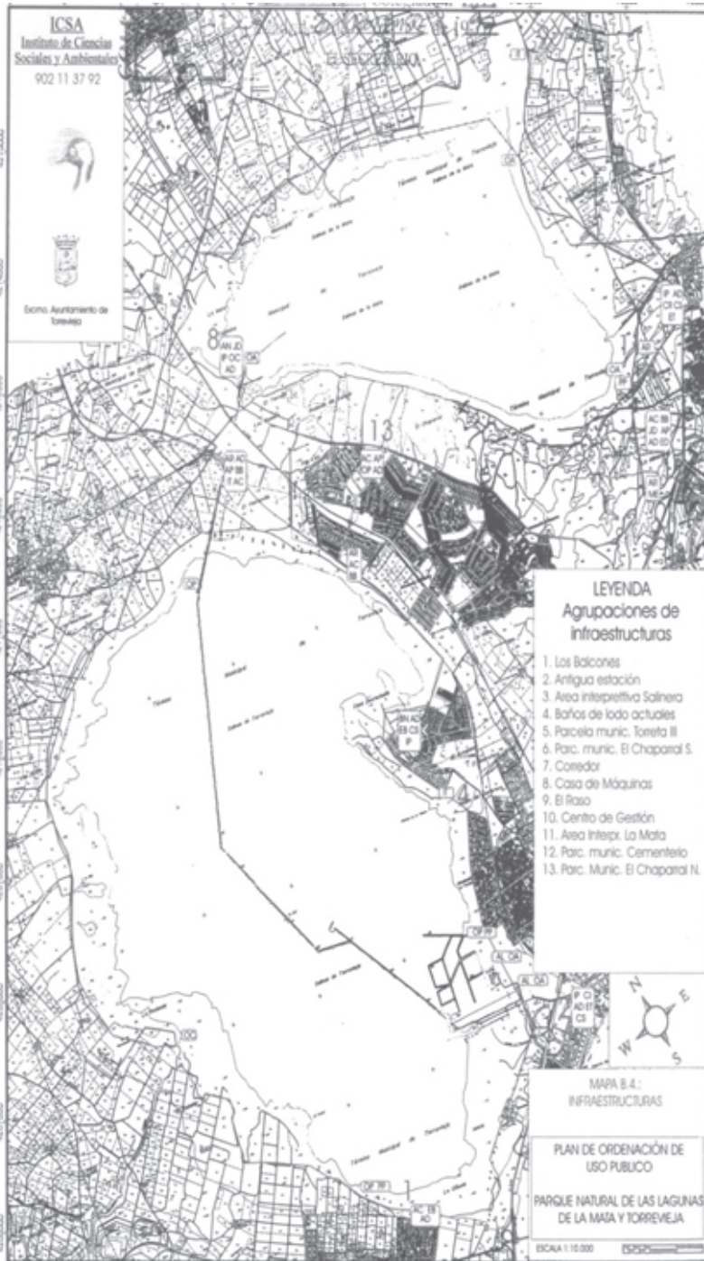
MAPA Nº 3: Infraestructuras previstas en el POU.P.