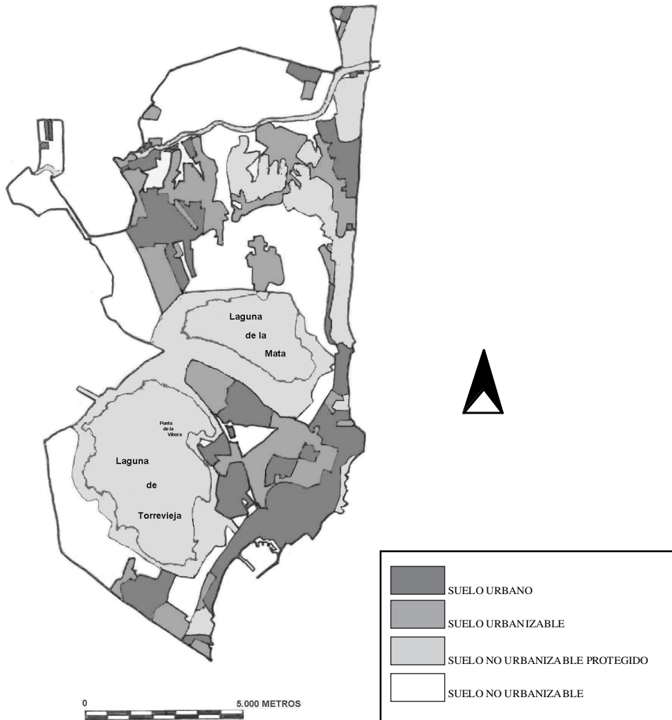
MAPA nº 2: Clasificación del suelo contenida en los documentos de planeamiento urbanístico de los municipios de la zona de estudio.

con la proliferación de adosados, que incrementan notablemente la densidad residencial. De la situación descrita se desprende también la fuerte presión que recae sobre el escaso suelo agrícola subsistente, reducido a una modesta porción que media entre la Laguna de La Mata y dicha pedanía y a la margen occidental de la laguna de Torrevieja, clasificado en ambos casos como Suelo No Urbanizable Común (SNUC) y, asimismo, sobre el propio Parque Natural que, aunque se incluye dentro del Suelo No Urbanizable Protegido (SNUP) quedando excluida la posibilidad de su urbanización, limita con zonas de Suelo Urbano y Urbanizable con alto grado de consolidación. Estas circunstancias revelan además la propia insostenibilidad del modelo de desarrollo del municipio, ya que las posibilidades de