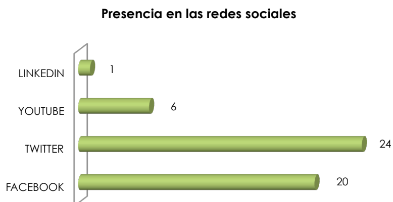
Gráfico 4: Presencia en las redes sociales