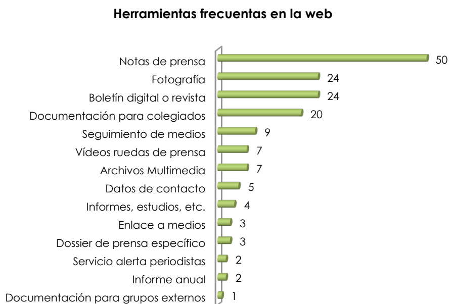
Gráfico 3: Herramientas de comunicación más utilizadas en la web