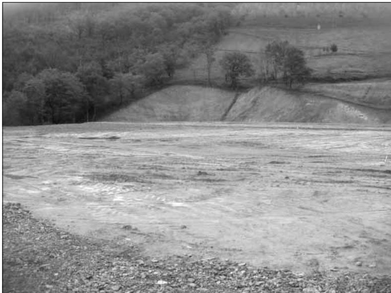
FIGURA 2. Obras de Acondicionamiento del Agroaldea de Astigarraga. Año 2004.

Los modelos de cesión o arrendamiento de las parcelas situadas en los agroaldeas mencionadas han sido variados. En algunos, la selección y adjudicación de las parcelas se ha realizado directamente entre la administración implicada (Ayuntamiento) y el usuario parti-