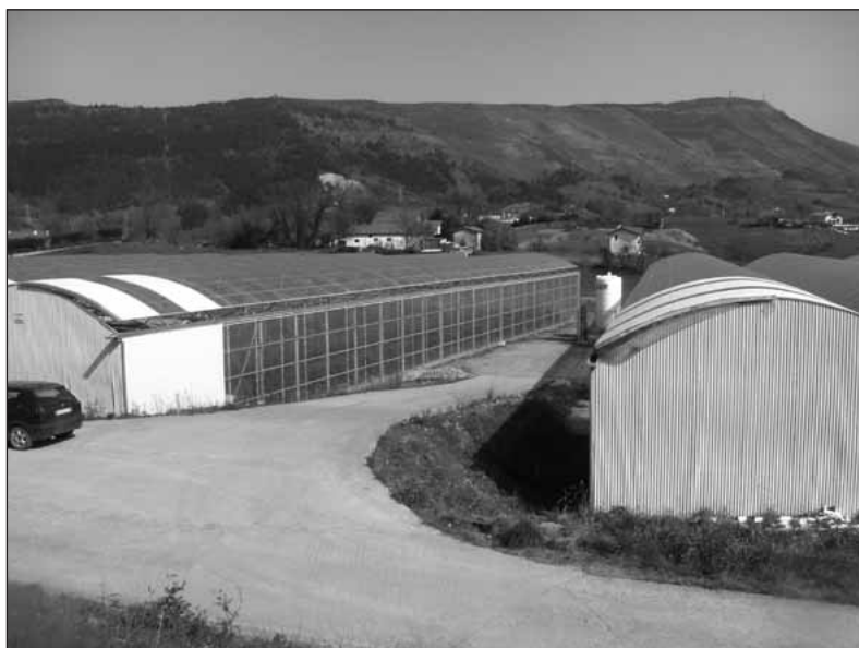
FIGURA 1. Agroaldea de Oiartzun. Año 2004.

materia de desarrollo rural, y entre éstos la aplicación de los programas diseñados en cada comarca se decide que sea realizada por órganos locales. En este sentido, se apuesta por la creación de una nueva figura, las Asociaciones de Desarrollo Rural, que se establecen como instrumento de participación y colaboración de los agentes económicos y sociales en las actuaciones de desarrollo rural. La Ley establece los requisitos para el reconocimiento de las ADR con el carácter de entidades de derecho privado y representativas de los diferentes sectores económicos y sociales de la zona comprendida en un PDR. Estas Asociaciones vienen a dar continuidad a las anteriores Asociaciones de Agricultura de Montaña o Agencias de desarrollo rural que ya existían en las diferentes comarcas y que se ven ahora reforzadas con la asunción de nuevas competencias otorgadas con la aprobación de los PDR comarcales y con su designación como responsables de la ejecución de sus contenidos.