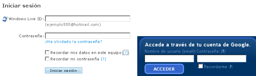
Figura 1: Opción “recordarme en este equipo” en Hotmail y Blogger

En la Figura 2 se muestra un ejemplo de cómo se tiene que hacer lo que se pide: a la izquierda se muestra el formulario de acceso cuando no se está recordando a un usuario, mientras que a la derecha aparece cómo se tiene que visualizar cuando se está recordando a un usuario.