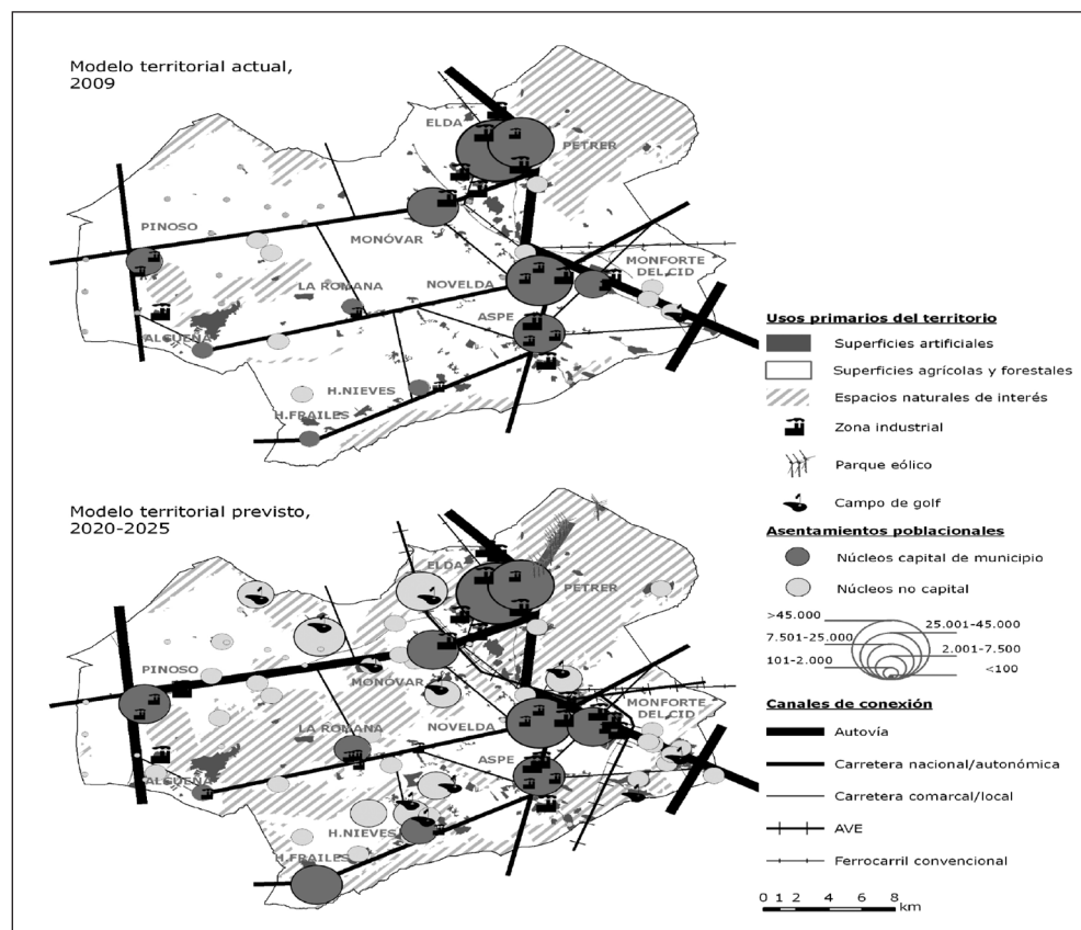
Figura 2 MODELO TERRITORIAL DEL MEDIO VINALOPÓ

Elaboración propia a partir del planeamiento municipal, Diario Oficial de la Generalitat Valenciana y prensa.