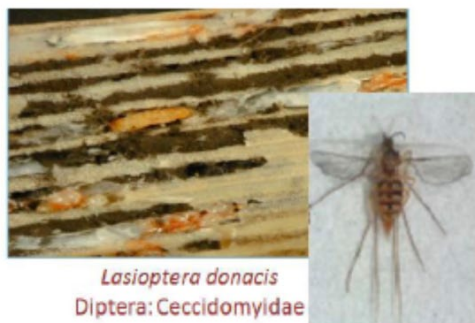
Lasioptera donacis Diptera: Cecidomyiidae