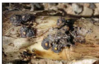
Rhizaspidiotus donacis Hemiptera: Diaspididae