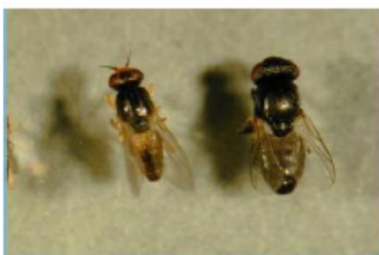
Cryptonevra spp. Diptera: Chloropidae

El TAG para el control biológico de plantas invasoras fue creado en 1987 y está formado por 15 agencias gubernamentales que representan a Estados Unidos, México y Canadá.