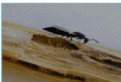
Tetramesa romana Hymenoptera: Eurytomidae