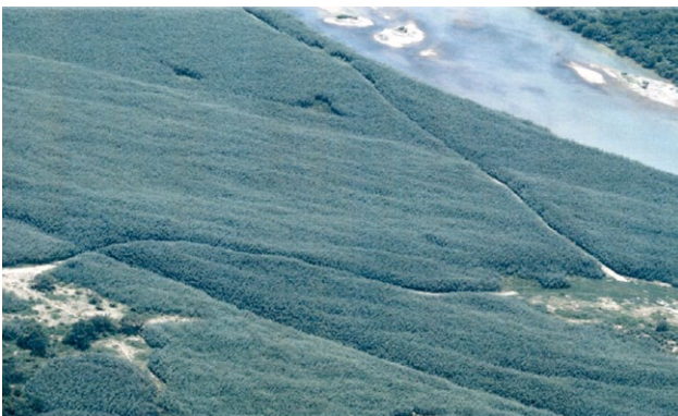
Figura 1. Río Grande a su paso por Del Rio (suroeste de Texas). Se observa el cauce invadido por Arundo donax .

A finales de la década de los 90 se iniciaba desde el Departamento de Agricultura de los EEUU (USDA) un ambicioso proyecto para frenar la invasión de una gramínea invasora, Arundo donax L. (Poaceae; Arundinoideae) en ecosistemas ribereños del Suroeste de EEUU y Norte de México mediante técnicas de control biológico (CORTÉS et al. 2009) Esta iniciativa surge ante la imposibilidad de controlar el crecimiento de Arundo donax mediante métodos químicos y mecánicos. Una de las áreas más fuertemente afectadas es la cuenca de río Grande, que ejerce de frontera entre ambos países y que actualmente ya cuenta con casi una tercera parte de sus 3000 km de longitud invadidos por A. donax . En las zonas ribereñas donde crece en importantes densidades, esta planta de gran porte erosiona los cauces, desplaza a la vegetación nativa (especies pertenecientes a los géneros Salix , Populus o Bacharis ) y con ello, a su fauna asociada que en muchas ocasiones se encuentra amenazada como las aves autóctonas de pequeño tamaño Vireo bellii pusillus (Coues, 1866) y Empidonax traillii extimus (Phillips, 1948), entre otras (ZEMBAL, 1986, 1990; BELL, 1997).