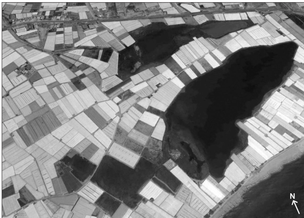
FIGURA 2. Imagen oblicua de la Albufera de Adra. Nota: la escala varía en esta perspectiva, del extremo este al extremo oeste de la Albufera Nueva (la lámina de agua más cercana a la costa) distan poco más de 1.025 metros.

(particularmente la ornitológica) puede considerarse para estimar el valor de una zona húmeda (Casado y Montes, 1995).