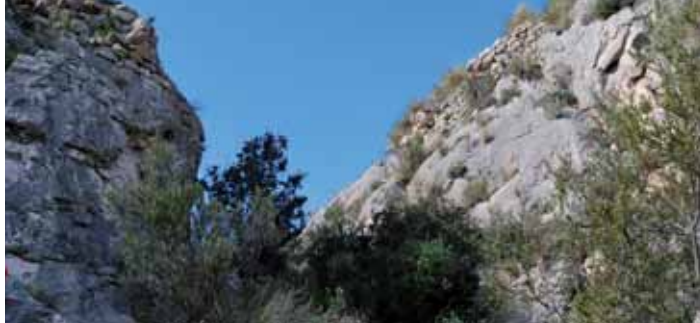
Fig. 5: Accés a la penya del Castellet, amb els murs que defensaven l'entrada damunt la roca natural.

A partir d'aquests arguments, els autors extreien la següent conclusió: “ La pared que queda en pie actualmente es resto de esta edificación, y no como se cree del castillo musulmán ” (CAMPÓN GONZALVO & PASTOR I FLUIXÀ, 1989: 17) 17 .