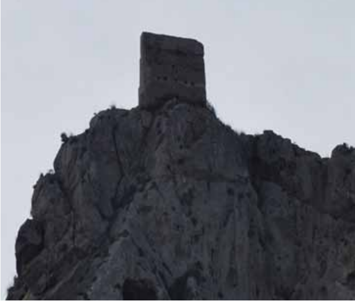
Figs. 3: Mur del Castellet del Mascarat. Foto des de l'est feta abans de la seua consolidació.

próximo, achacarse a los árabes, que construyeron torrecillas en inaccesibles peñascos para servirles de atalaya, o protectora defensa de los amenos valles que dominan " (PRADO, 1918: 110-111). 10