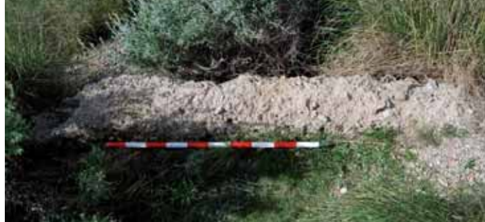
Fig. 6: Restes dels fonaments del mur S de l'edifici rectangular del castell (font: els autors).

La ubicació de la torre moderna, a partir d'aquest testimoni, queda absolutament clara: baixant el port cap a Altea (havent deixat ja arrere el port de Calp i Oltà) i abans de travessar el Barranc Salat, “ quedaba á la izquierda sobre un cerro la torre del Mascarat ” (torre que seria idèntica a la de la Galera, ja que les posava en relació), una notícia que concordaria doncs amb les anteriors