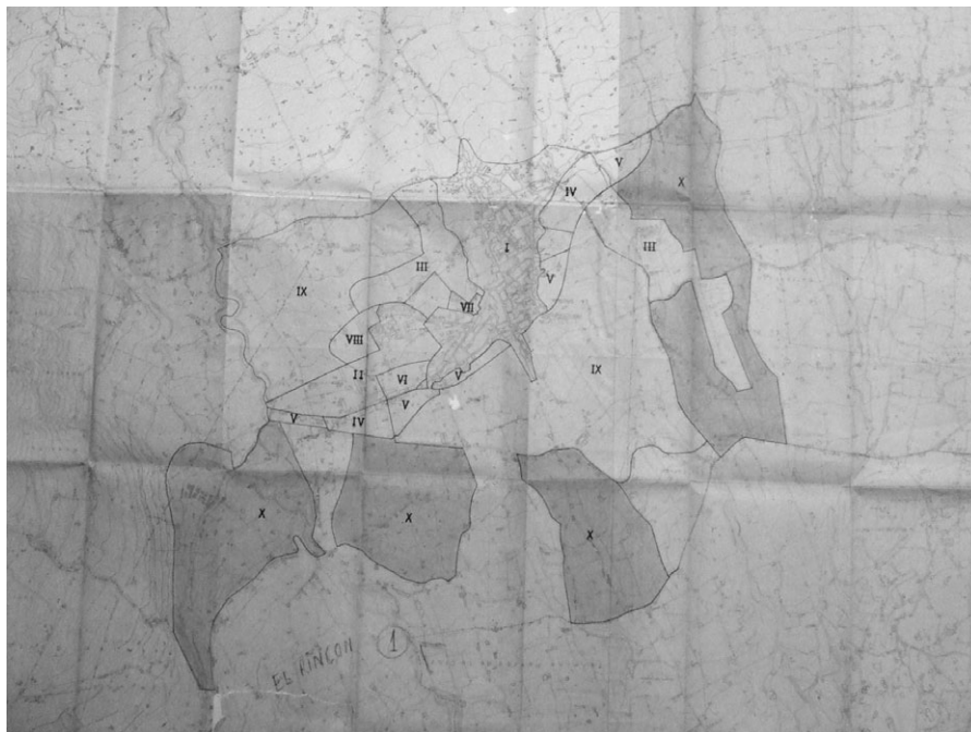
FIG. 5. Plano de Clasificación del Suelo en La Orotava según el PGOU de 1963

Clasificación del Suelo Urbano y Urbanizable: Zona I: Casco urbano y ensanche del mismo; Zona II: Urbana colectiva y unifamiliar en fila; Zona III: Ciudad jardín; Zona IV: Turística; Zona V: Uso de vivienda con tolerancia de pequeña industria; Zona VI: Cívico-comercial; Zonas Especiales: VII militar, VIII deportiva, IX reserva urbana, X nuevos sectores de reserva urbana con carácter y uso de ciudad jardín.