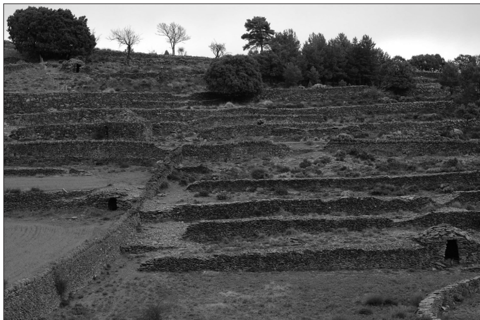
FIGURA 2. Terrazas de Vilafranca (Castellón).