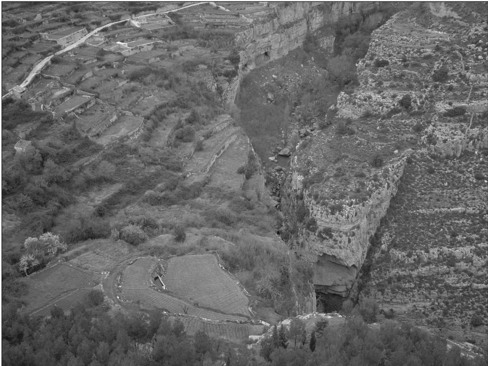
FIGURA 6. Parcelas de regadío aterrazadas junto al municipio de Alpuente (Valencia).

Por último, los Programas de Paisaje, que según el Reglamento materializarán las acciones de gestión que se deriven de los Estudios y de las políticas de paisaje, deberían incluir una figura similar al Fondo para la Protección, Gestión y Ordenación del Paisaje de Cataluña, creado con la finalidad de destinarlo a actuaciones de mejora paisajística;