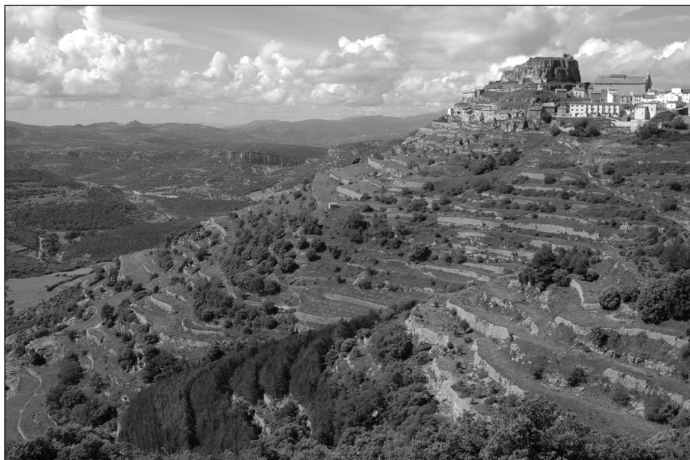
FIGURA 1. Aterrazamientos en Ares del Maestre (Castellón).