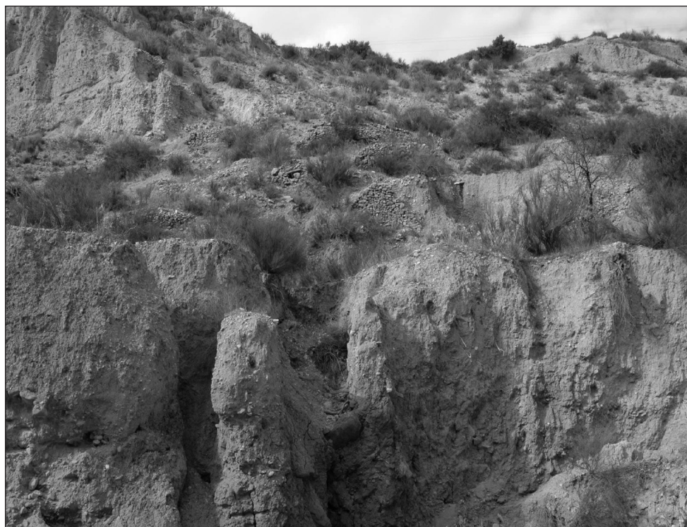
FIGURA 3. Procesos de erosión en campos de cultivo aterrazados abandonados (Petrer, Alicante).

La finalidad de estas acciones es conservar y, en su caso, ordenar y gestionar los espacios, recursos y elementos naturales y culturales, para impedir la alteración o degradación de