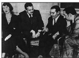
Lorca y Neruda.