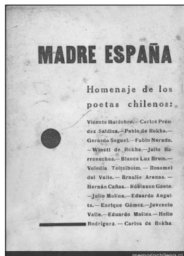
Cubierta Madre España .