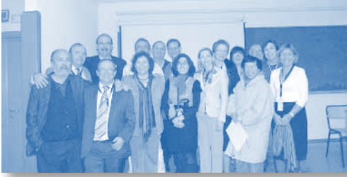
Integrantes de la Primera Junta Directiva de la Federación Iberoamericana de Historia de la Enfermería. Alicante España 25 de noviembre 2011