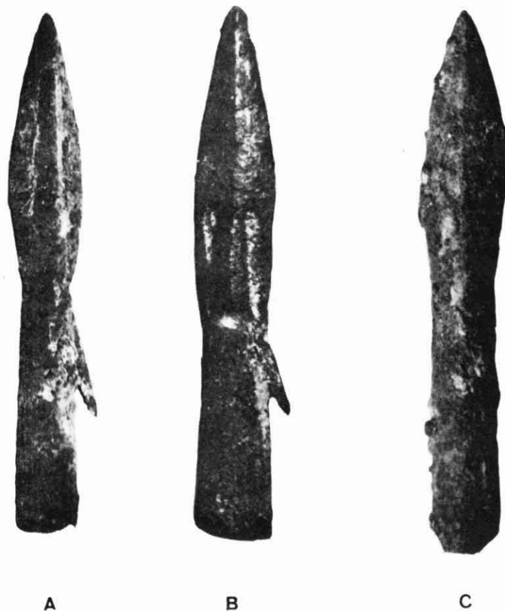
Fig. 2. — Fotografía de las piezas núms. 1 (A), 2 (B) y 5 (C).

Este tipo exótico de punta de flecha tiene amplios paralelos por todo el Mediterráneo, en particular en colonias y factorías griegas y fenicio-púnicas o en zonas de influencia de uno u otro mundo,