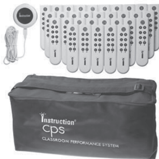
Figura 2: Paquete completo de clickers de la empresa eInstruction

En nuestras clases y experimentos hemos utilizado un paquete de 32 clickers de la empresa eInstruction ( http://www.einstruction.com ) junto con su potente software Classroom Performance System. El conjunto completo lo podemos observar en la Figura 2.