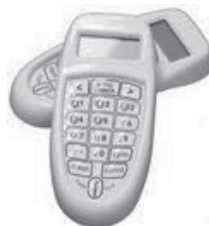
Figura 1. Uno de los muchos modelos de clickers

Los clickers o mandos interactivos son unos dispositivos electrónicos de la familia de los Sistemas de Respuesta de la Audiencia (ARS en inglés) parecidos al mando a distancia de un televisor que funcionan mediante control remoto (ver Figura 1). Existen infinidad de prototipos (Barber & Njus, 2007) diferentes siendo los más comunes aquellos más sencillos y económicos que incluyen sólo unas pocas teclas, la mayoría de veces suficientes para el objetivo final.