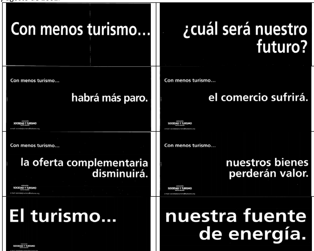
Figura 1. Anuncios publicitarios contra la ecotasa balear y sus efectos de regulación de la oferta de alojamiento turístico aparecidos profusamente en la prensa local los meses de julio y agosto de 2002.