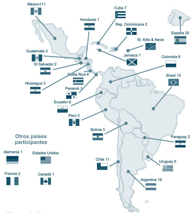
(Fig. 1a) Países

Con este fin se llevó a cabo la Conferencia Iberoamericana de Reservas de Biosfera en Puerto Morelos, Quintana Roo, México del 9 al 13 de noviembre de 2010 (Fig.2), con la participación de los gestores de 102 reservas de biosfera (Fig.1b), los puntos focales y representantes de 21 comités nacionales MaB, que forman parte de la Red y autoridades encargadas de la política y la administración de las áreas naturales protegidas de varios países (Fig.1a).