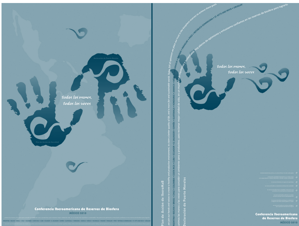
Fig. 2. Cartel anunciador de la Conferencia Iberoamericana de Reservas de Biosfera

Durante la conferencia se identificaron las limitaciones y fortalezas que debemos superar y aprovechar y con base en ello elaborar un Plan de Acción, que dé cohesión a IberoMaB y facilite la participación conjunta de reservas y comités durante los próximos 20 años.