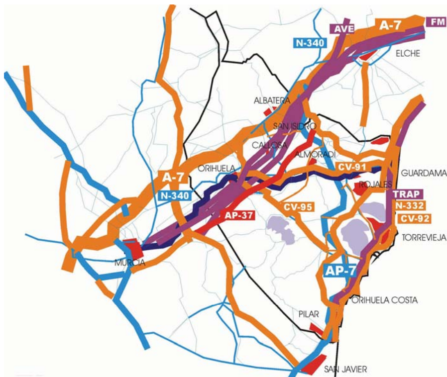
Figura 2. Infraestructuras de transporte previstas en la comarca de la Vega Baja 2009-2020.

En el caso del AVE en la primera opción que se presentó desde Fomento este discurriría paralelo a la A-7 siendo sus impactos prácticamente nulos para la huerta tradicional. En cambio, dicho proyecto se abandona a favor de uno con más impactos negativos y además más costosos puesto que supone unas mayores expropiaciones y además atraviesa varios núcleos urbanos en los que hay que acometer obras muy costosas para paliar sus efectos negativos.