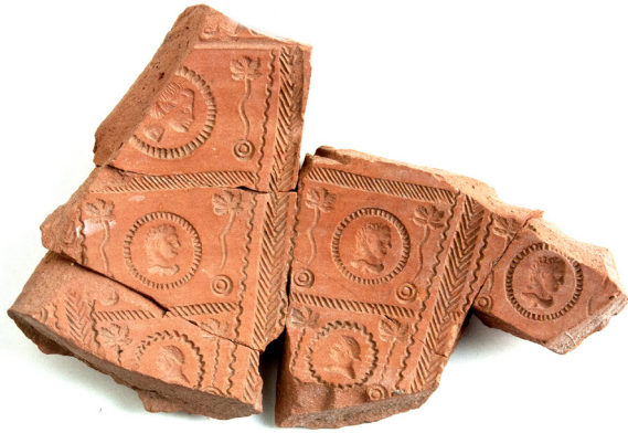
Figura 4: Molde con efigies de Domiciano y de dos personajes de la domus Flavia .

Numancia (Garray, Soria), Laminium (Alhambra, Ciudad Real), El Convento (Mallén, Zaragoza) y Tarragona (Sáenz Preciado, 1996-1997: 554 ss.; Sáenz Preciado y Sáenz Preciado, 2015: 176/not.7; Fuentes Sánchez, 2019). En Lusitania se conocen hallazgos en Mérida y en Contributa Iulia (Medina de las Torres, Badajoz) (Bustamante Álvarez et al. 2017: fig. 1.2-5). En Mérida destacan varias piezas con busto de Domiciano y de otros miembros de su domus (Bustamante Álvarez, 2010: 42-45, figs. 1 y 2; 2011: 103-104, figs. 101 y 102; 2013: 164, lám. 193.1/5). Todos los hallazgos anteriores remiten a La Cereceda como punto de origen. Respecto a los emeritenses, se hallaron en un contexto estratigráfico antoniniano no lejos del área de culto imperial, por lo que se ha propuesto que se trataría de cuencos rituales o votivos de culto a los Flavios (Bustamante Álvarez, 2010; 2011: 104 ss.). Con independencia de la datación estratigráfica y teniendo en cuenta la damnatio memoriae que siguió al asesinato de Domiciano en septiembre del 96 (Suet. Dom. 23.1; Dio 68.1.1), hemos de entender que las cerámicas con sus efigies se produjeron en el alfar tritiense antes de esta última fecha.