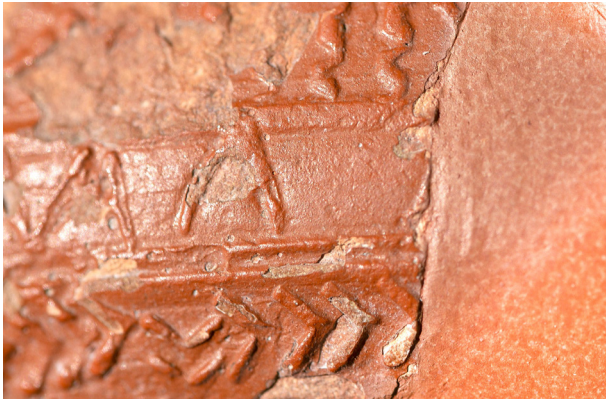
Figura 3: Detalle de la inscripción con restos de la preposición AB después de FORMA.

epigráfica en su conjunto: vincula forma y monarca de modo indubitable, define una expresión en voz pasiva con el monarca como complemento agente, por ello exige la presencia en el texto de un participio, aquí del verbo do o iubeo concordando con forma , y finalmente da sentido a forma no como molde sino como disposición o norma jurídica.