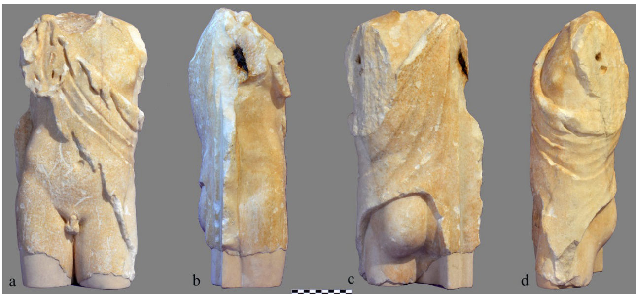
Figures 4: Vistes frontal (a), posterior (c) i laterals (b-d) del tors de Miraflor després de la restauració

dos braços, doncs, eren elements independents que anaven units amb ànimes de ferro i estaven separats del cos. La inclusió d'aquests elements metàl·lics podria haver-se produït com a conseqüència d'una fractura. No es veuen restes de cap altre element de subjecció en tota la figura, com podria ser algun puntello . La disposició dels plànols de connexió amb els braços i l'orientació del pern conservat s'adiuen amb una posició del braç dret lleugerament avançat, possiblement paral·lel al cos, i de l'esquerre alçat i un poc endarrerit. En els laterals no es veu una empremta o part d'un tronc o pilar que pogués servir com a element de suport de la figura; possiblement sí que existí en el costat dret, però devia estar situat a menor altura de la línia de fractura de la cuixa corresponent i per tant ha desaparegut.