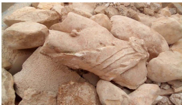
Figura 2: El tors de Mirafior al lloc de la troballa