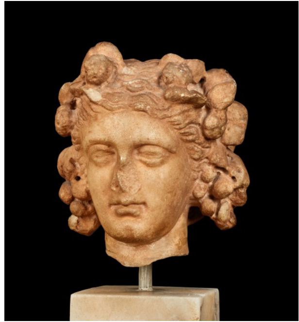
Figura 8: Cap de Dionís de Sagunt (Imatge: Francesc Vera)

Per les seues proporcions menors que el natural, el Dionís de Mirafior es pot incloure en l'àmplia categoria d'escultures que repliquen a menor escala les còpies de mida natural, i pot considerar-se allò que Bartman (1992) defineix com una 'còpia en miniatura'. Les peces d'aquesta mena són prou freqüents i s'inclouen majoritàriament en l'escultura ideal. Així, les