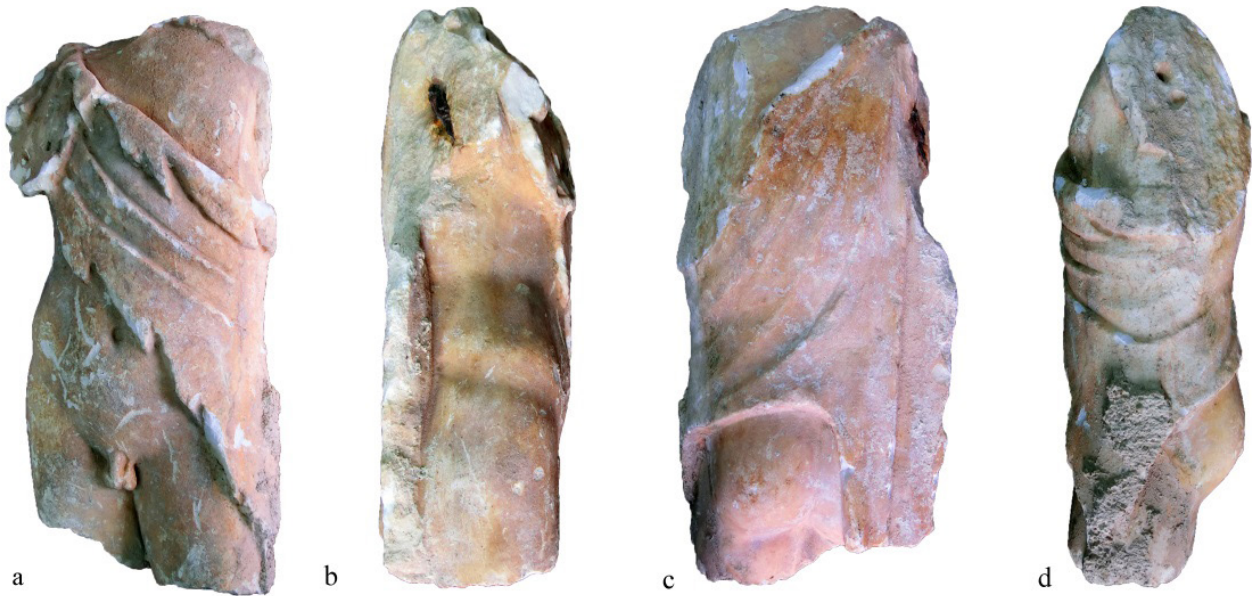
Figura 3: Vistes frontal (a), posterior (c) i laterals (b-d) del tors de Miraflor abans de la restauració