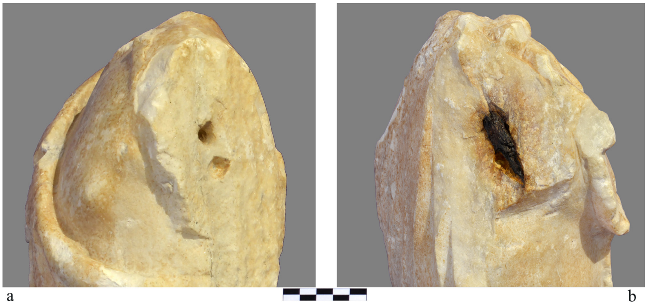
Figura 5: a. Detall del muscle esquerre amb els orificis per al pern (Imatge: Enric Martínez García); b. Detall del muscle dret amb la tija de ferro (Imatge: Enric Martínez García)

assenyalat. El melic és arrodonit i poc profund. El sexe està prou ben conservat, presenta trets d'immaduresa i no té vell púbic; el penis i el costat esquerre de l'escrot estan delimitats amb fines ranures de trepant. La pell del déu conserva el poliment en bona part de la superfície.