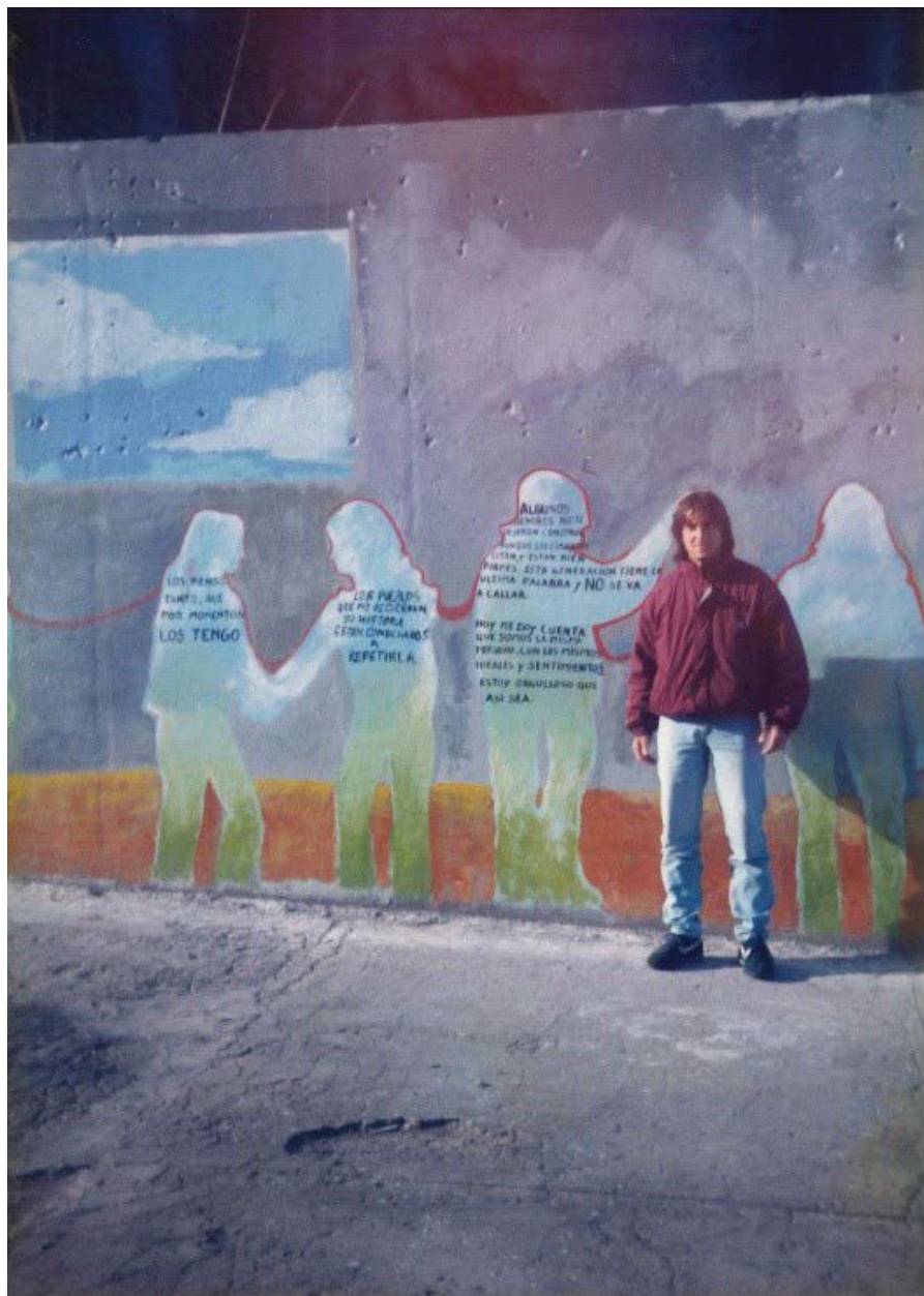
Fragmento del mural realizado por H.I.J.O.S Mar del Plata en 1995