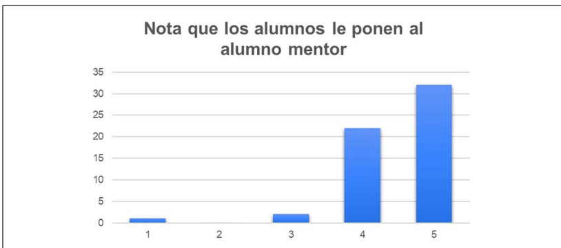
Figura 3.9. Nota que los estudiantes le ponen al alumno mentor.

igual o inferior al alumno mentor, lo que indica que la satisfacción que la mayoría de estudiantes ha obtenido del programa de alumnado mentor ha sido muy positiva (véase la figura 3.9).