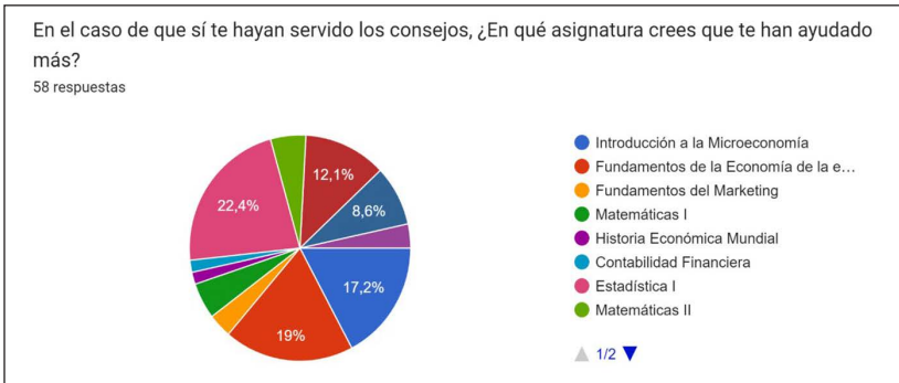
Figura 3.8. Respuestas referidas a la pregunta: «En el caso de que sí te hayan servido los consejos, ¿en qué asignatura crees que te han ayudado más?».

igual o inferior al alumno mentor, lo que indica que la satisfacción que la mayoría de estudiantes ha obtenido del programa de alumnado mentor ha sido muy positiva (véase la figura 3.9).