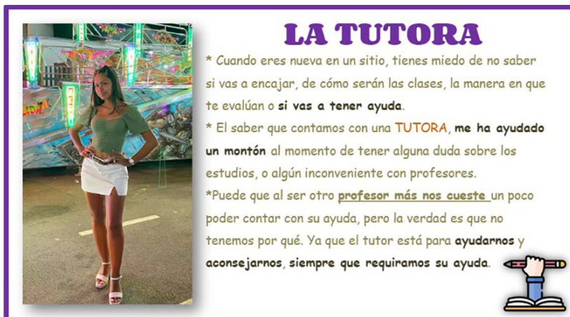
Figura 3.4. Imagen que recoge la opinión de la estudiante sobre la tutora.