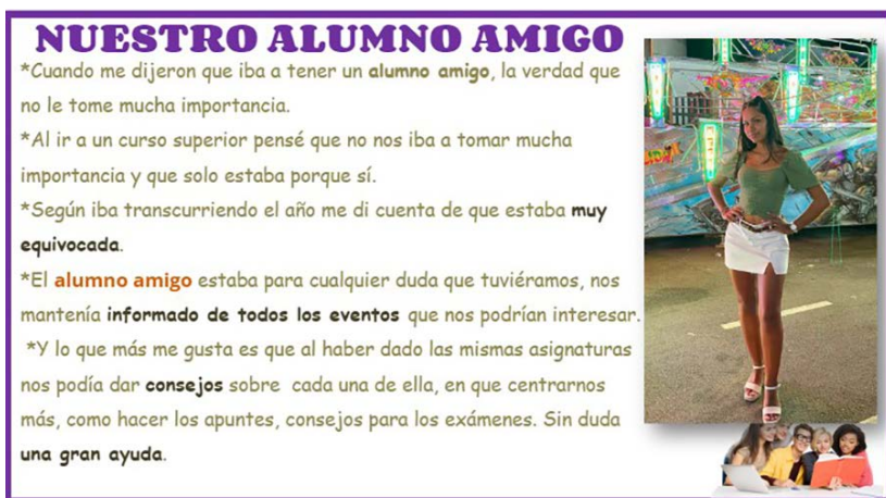
Figura 3.5. Imagen que recoge la opinión de la estudiante sobre el alumno mentor.