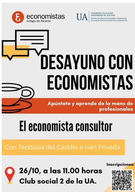
Figura 3.1. Imagen de una de las actividades que el alumno-tutor hizo llegar al grupo de estudiantes.

tor intenta hacer un cambio en la manera de ayudar a los grupos asignados. De tal forma, se centra en las asignaturas del grado en Economía. En ese momento, junto con la profesora tutora se valoraron realizar algunas alternativas novedosas tales como hacer una videollamada para comentarles consejos sobre asignaturas o tratar de establecer una comunicación más directa haciendo algún encuentro presencial. Sin embargo, cada estudiante tiene una disponibilidad de horarios diferente y cuadrar a un número elevado de gente iba a ser un problema. Por lo tanto, se optó por la opción de mandar mensajes instantáneos a través de los grupos de WhatsApp ya mencionados. De esta forma cada alumno podría ver y consultar la información cuantas veces quisiera.