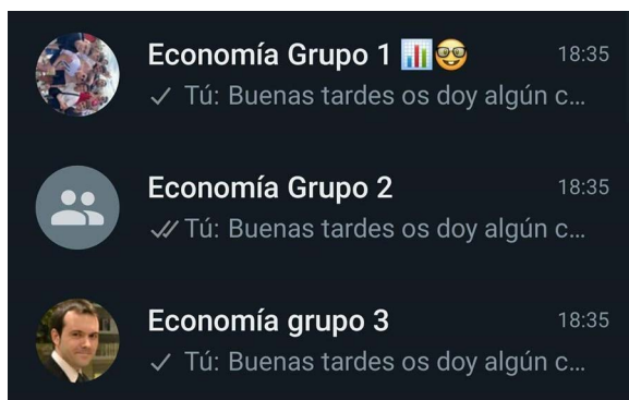
Figura 3.2. Imagen del grupo de WhatsApp tras decidir aplicar la estrategia 3 de acercamiento.

Debido a los malos resultados, decidió pasar a una tercera estrategia: mandar consejos y recomendaciones el día antes de un examen. De esta forma se acercaba al alumnado en un momento de extremo interés, ayudándoles a refrescar la memoria con aportes muy precisos y que a la hora de, por ejemplo, responder una pregunta tipo test son claves. La figura 3.2 muestra la reacción al grupo de WhatsApp con todos los estudiantes y los delegados de cada curso.