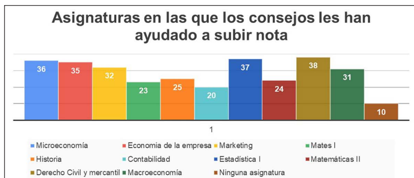
Figura 3.7. Respuestas referidas a las asignaturas en las que los consejos les han ayudado a subir nota.

En relación con la nota que los alumnos le otorgan al alumno mentor, hay que destacar que el 39,7% indica que el alumno mentor ha obtenido un 4 sobre 5; un 55,2% que el desarrollo ha sido 5 de 5; por último, tan solo un 5,1% ha dado una nota