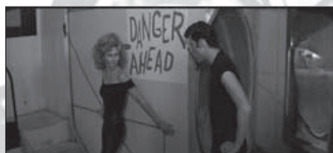
f.25 Grease (Kleiser, 1978)