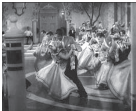
f.6 Top Hat (Sandrich, 1935)