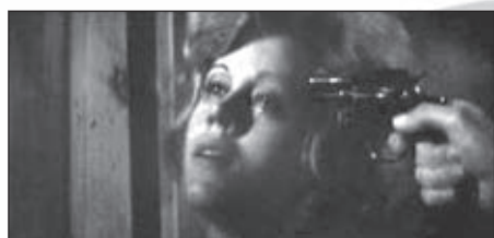
f.23 They Shout Horses, Don't They? (Pollack, 1969)

A finales de esta década, cuando comienza a ser notorio el ocaso del género musical, se estrena They Shout Horses, Don't They? (Pollack, 1969), película en la que la deconstrucción del baile de pareja es ya manifiesta. Es el comienzo del cine musical posclásico. Ante el trágico final de esta película, comienza a vislumbrarse un tema relacionado con la problemática de la relación entre los sexos: la repudiación de la feminidad 8 . La mujer, que en el manierismo era elevada a las alturas y admirada con fascinación, ahora es eliminada (f.23) o arrojada al vacío (f.24). En esta etapa también encontramos musicales que plantean la relación sexual como algo amenazador, peligroso (f.25), y otros que tienen un carácter profundamente melancólico, pues aluden en sus puestas en escena a los musicales clásicos como fuente de inspiración o como refugio emocional ante la desesperación (f.26-f.27).