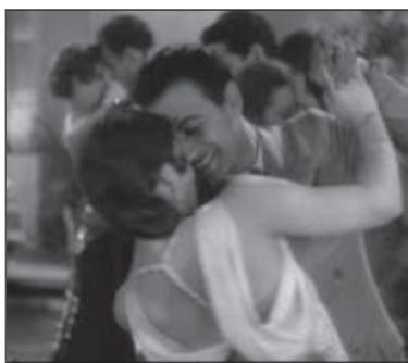
f.3 Flying Down to Rio (Sandrich, 1933)

Para abordar el tratamiento que, en las tramas del musical clásico, se da al baile de pareja como parte de la puesta en escena de la dialéctica sexual, quiero reparar en una figura a la que llamo la caída sostenida . En ella la mujer adopta una postura que en la terminología propia del baile se llama cambré —galicismo que significa “echar el busto hacia atrás”— y destaca, tanto en bailes de pareja individuales (f.4, f.7-f. 11), como en bailes de pareja corales, (f.3, f.5, f.6), como una figura prototípica.