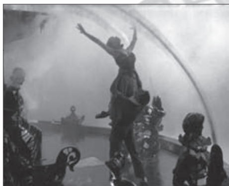
f.15 An American in Paris (Minnelli, 1951)

A finales de los años cuarenta otra postura, el porté , empieza a ocupar el lugar destacado que antes ocupaba el cambré , que, aunque no desaparece en las coreografías, pierde centralidad. En el musical manierista la mujer comparece rígida y elevada por su pareja de baile (f.15). Pero no sólo eso, sino también poniendo en escena su potencia , en ocasiones superior a la de un hombre a quien tiene que ayudar a ponerse en pie (f.16).