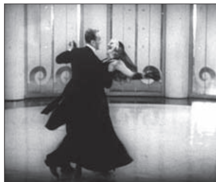
f.7 Shall We Dance (Sandrich, 1937)