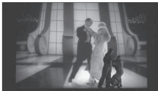
f.27 Pennies from Heaven (Ross, 1981)

No obstante, a pesar de que en las propuestas del cine musical de las décadas más recientes predomina la idea de la imposibilidad de la relación sexual, culminando en la exclusión del sexo contrario planteada en Chicago , y en la muerte de la mujer amante puesta en escena en Moulin Rouge! , es necesario señalar que en algunos musicales de esta última etapa se sigue recurriendo a los bailes de pareja para articular la experiencia sexual de los protagonistas. Tales son los casos paradigmáticos de Saturday Night Fever (f.28) y de Dirty Dancing (f.29).