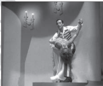
f.11 Cover Girl (Ch.Vidor, 1944)

En la popular Top Hat ( Sombrero de Copa , Mark Sandrich, 1935) 5 , la caída sostenida representa de manera especialmente paradigmática la entrega al goce sexual de la protagonista (f.13), y aparece en el núcleo de la trama flanqueada por sendas secuencias antitéticas en las que la mujer propina al hombre una bofetada (f.12-f.14).