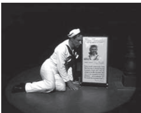
f.30 On the Town