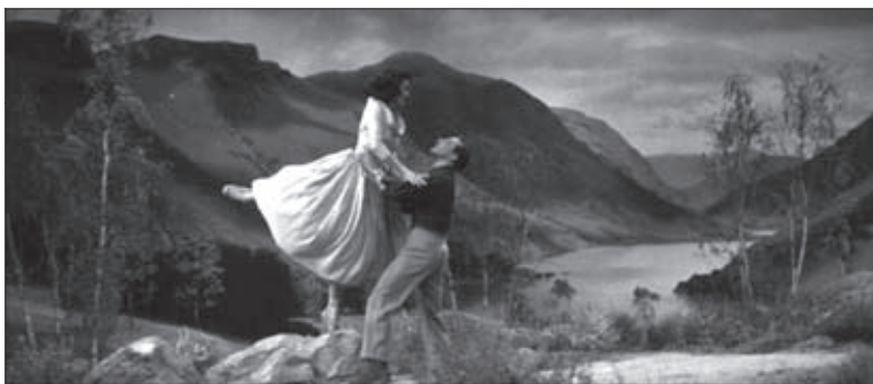
f.17 Brigadoon (Minnelli, 1954)