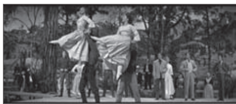
f.19 Seven Brides for Seven Brothers (Donen, 1954)

Otra de las características de las coreografías manieristas son las rutinas acrobáticas que, a pesar de mostrar explícitamente la destreza física de los hombres y mujeres que las realizan (algo que contrasta notablemente con las maneras de los bailarines del musical clásico en las que, como constatan los expertos en baile, lo difícil parece fácil a los ojos del espectador 7 ), restan fuerza a su sentido sexual (f.19-f.20).