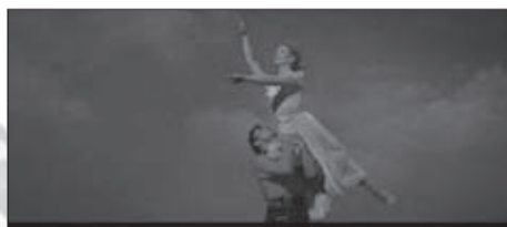
f.20 Oklahoma (Zinnemann, 1955)

Tras los fascinantes acrobatisms que llenan los bailes de los musicales de los años cincuenta, en las primeras producciones musicales de los años sesenta comenzamos a ver cómo mujer y hombre pierden pie, no se sostienen: bien como muestra de una violencia descontrolada (f.21) o bien como articulación paródica del encuentro sexual (f.22).