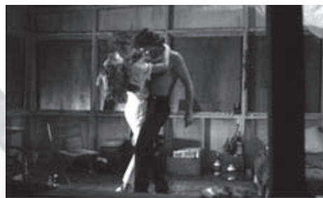
f.29 Dirty Dancing (Ardolino, 1987)