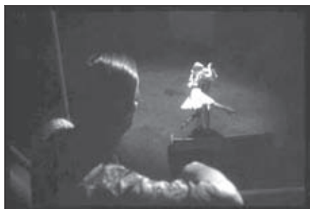
f.26 New York, New York (Scorsese, 1977)