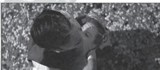
f.2 Moulin Rouge!