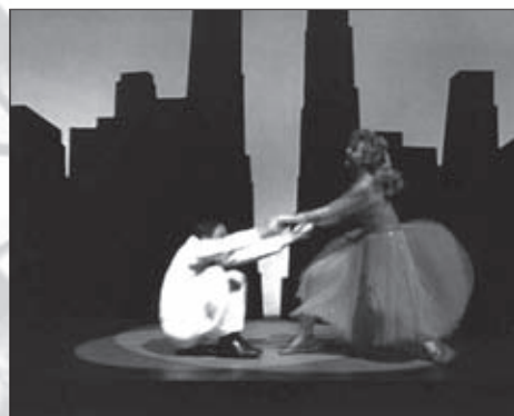
f.16 On the Town (Donen, 1949)

A menudo, esa figura adorada por el hombre que encarna la mujer en el orden manierista aparece ubicada en escenarios imaginarios , y si la caída sostenida tiene lugar, lo es en fantasías del protagonista donde el cuerpo de la mujer es, además, retratado como un ente puro y evanescente cuyo cuerpo, en algunas secuencias y tramas, llega literalmente a desaparecer (f.17 y f.18).