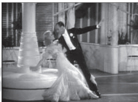
f.4-f.5 The Gay Divorcee (Sandrich, 1934)