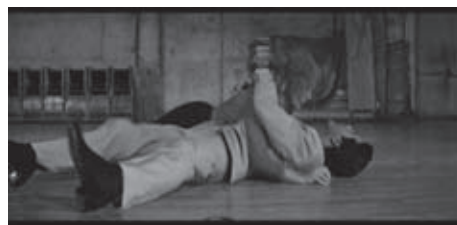
f.22 Viva Las Vegas! (Sydney, 1963)