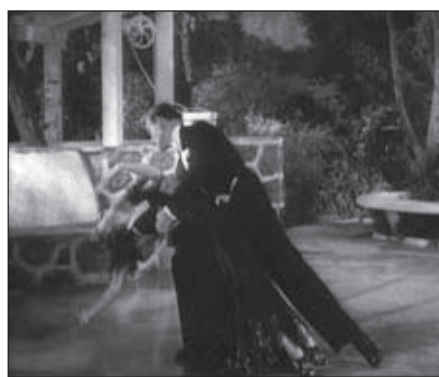
f.8-f.9 Carefree (Sandrich, 1938)