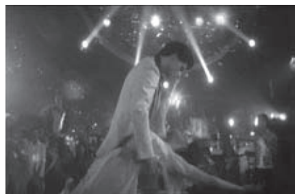
f.28 Saturday Night Fever , (Badham, 1977)

No obstante, a pesar de que en las propuestas del cine musical de las décadas más recientes predomina la idea de la imposibilidad de la relación sexual, culminando en la exclusión del sexo contrario planteada en Chicago , y en la muerte de la mujer amante puesta en escena en Moulin Rouge! , es necesario señalar que en algunos musicales de esta última etapa se sigue recurriendo a los bailes de pareja para articular la experiencia sexual de los protagonistas. Tales son los casos paradigmáticos de Saturday Night Fever (f.28) y de Dirty Dancing (f.29).