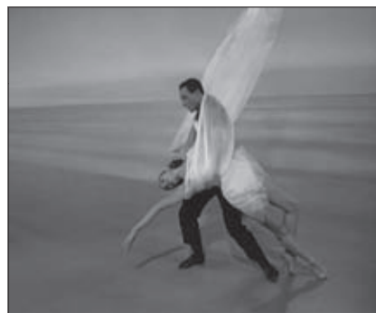
f.18 Singing in the Rain (Donen y Kelly, 1952)

Otra de las características de las coreografías manieristas son las rutinas acrobáticas que, a pesar de mostrar explícitamente la destreza física de los hombres y mujeres que las realizan (algo que contrasta notablemente con las maneras de los bailarines del musical clásico en las que, como constatan los expertos en baile, lo difícil parece fácil a los ojos del espectador 7 ), restan fuerza a su sentido sexual (f.19-f.20).