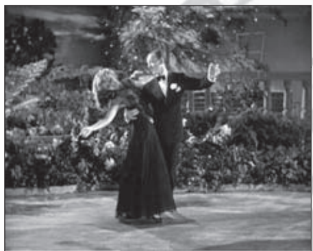
f.10 You never Were Lovelier (W.A. Seiter, 1942)