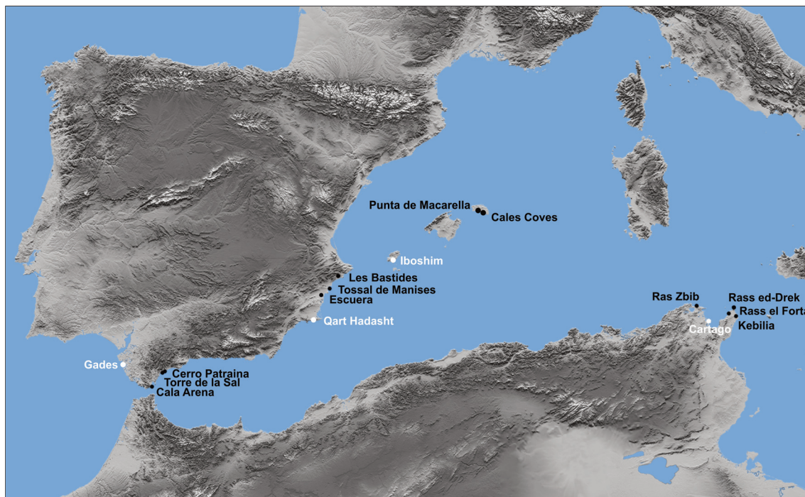
Fig. 5. Localización de puntos de vigilancia (torres, atalayas, fortines) en diversas áreas del Mediterráneo occidental entre la Primera y la Segunda Guerra Púnica.