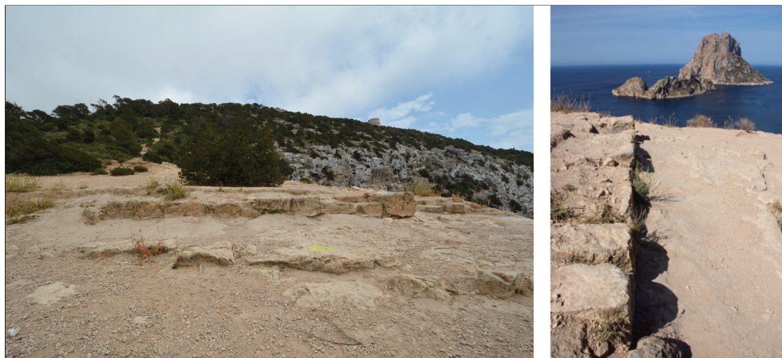
Fig. 4. Dos perspectivas del muro visible en s'Era des Mataret con la torre moderna de Savinar al fondo y el islote d'es Vedrà.