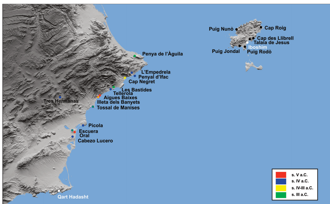
Fig. 1. Mapa de las costas alicantina e ibicenca con la localización de los yacimientos citados en el texto: 1.Cap Roig, 2. Cap des Llibrell, 3. Talaia de Jesus, 4. Puig Rodó, 5. Puig Jondal, 6. Puig Nunó, 7. Penya de l'Àguila, 8. Empedrola, 9. Penyal d'Ifac, 10. Cap Negret, 11. Bastides, 12. Tellerola, 13. Aigües Baixes, 14. Illeta dels Banyets, 15. Tres Hermanas, 16. Tossal de Manises, 17. Picola, 18. Escuera, 19. Oral, 20. Cabezo Lucero.

Tossal de Manises antes de desencadenarse la Segunda Guerra Púnica (Olcina et alii 2017); la factoría y puerto de la Illeta dels Banyets y el fortín de Aigües Baixes (Olcina et alii 2017; Sala et alii 2017) situados en el punto del litoral alicantino donde las largas playas de arena meridionales son sustituidas por calas y acantilados para el refugio puntual de naves sorprendidas por un temporal; la costa acantilada que sigue a partir de aquí hacia el norte está jalonada por posibles torres y/o pequeñas atalayas conectadas visualmente hasta llegar al puerto de Dianium , y quizá enclaves como la “factoría púnico-ebusitana” del Tossal de la Cala y el Penyal de Ifac, que empezamos a entender por su analogía con la Illeta dels Banyets en cuanto a la ubicación en pequeñas penínsulas, además de ser lugares de producción de bienes y de intercambio, podrían constituir un sistema mixto productivo y de control de la costa, puesto a funcionar en diferentes situaciones críticas que habrían tenido lugar entre los siglos V y III a.C. (Fig. 1).