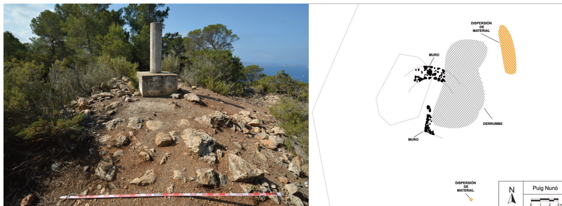
Fig. 2. Imagen y planimetría de los restos inmuebles y dispersión de hallazgos muebles en la cima de Cap Nunó.

La documentación gráfica resultante está todavía en proceso de definición, aunque nos sirve como adelanto la imagen de Cap Nunó (Fig. 2). En la cima documentamos una acumulación de tierra y piedras de planta pseudo-circular formando un túmulo de escasa altura en cuyo centro se ha ubicado un vértice geodésico del IGN. Al norte y sur de vértice respectivamente, son visibles en superficie un muro de doble paramento de mampostería, de trazado circular y un metro aproximado de grosor y una estructura cuadrada de mampostería trabada con mortero de cal a la que se le adosa una alineación de piedras de tendencia circular; en el extremo del túmulo se acumula un derrumbe de piedras medianas. Este registro es compatible con una construcción de planta circular bastante arrasada que habría provocado esta anomalía en la superficie del terreno. La entidad de dicha estructura podría ser considerable teniendo en cuenta el grosor de un 1 m que presenta el tramo de muro visible y los 6 m de diámetro de la elevación del terreno.