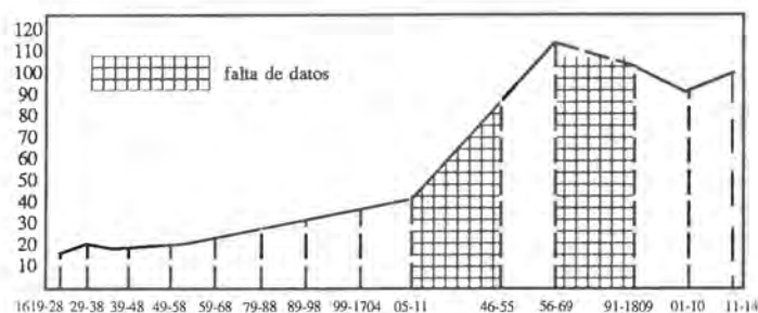
EVOLUCION DEMOGRAFICA DE BENEJUZAR (MEDIDAS DECENALES 1619-1814)

En cuanto a la evolución demográfica del pueblo, los datos más antiguos de que disponemos señalan que había 49 habitantes en el año 1.579 y 63 en 1.590 (la fuente es el Archivo Municipal de Orihuela). A partir de aquí hay un vacío de documentos hasta el siglo XVIII que solo podemos llenar con el número de nacimientos en cada año (Archivo Parroquial de Benejuzar). Se verifica que entre 1.619 y 1.688 el crecimiento es lento, pero a partir de 1.689 el ritmo ascendente de nacimientos se acentúa alcanzándose la media más alta entre 1.791 y 1.800.