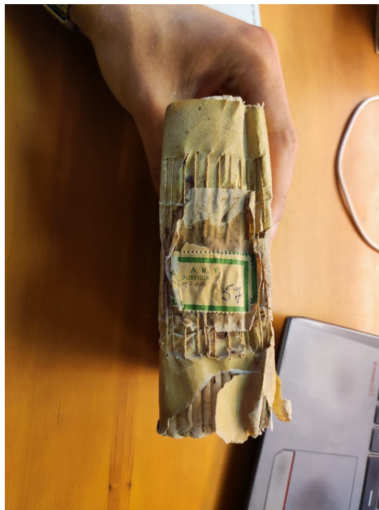
Fotografia 2. Part lateral del llibre de paus i treves de la cort del Justícia Criminal, 1470-1472.