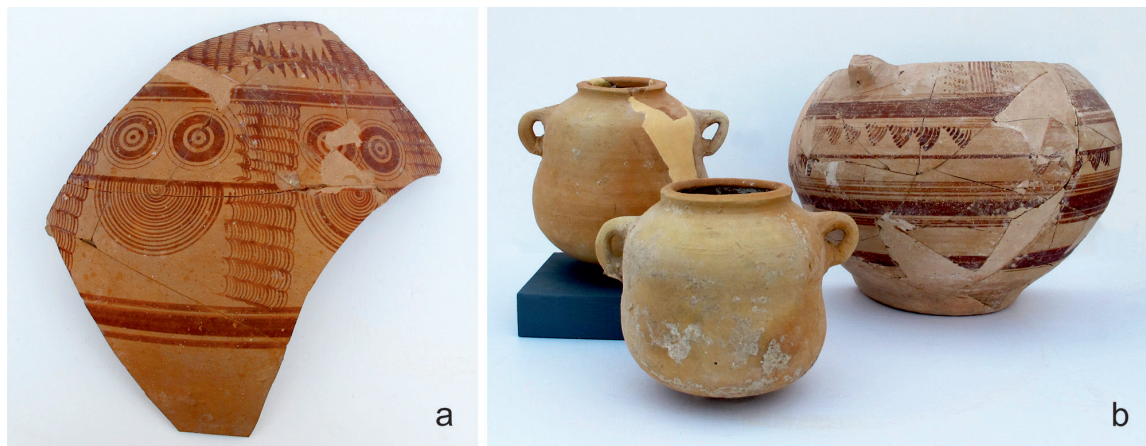
Fig. 1. Cerámica del período ibérico antiguo de La Alcudia: a) fragmento con decoración geométrica, y b) anforiscos y urna de orejetas globular.

Un poco más al interior, junto al margen izquierdo del río Vinolopó, se encuentra el yacimiento de La Alcudia (Elche, Alicante). Enclave excepcional por su colección de estatuaria y altorrelieves fechados entre los siglos V y IV a.C., no parece ofrecer hasta la fecha contextos cerámicos que nos indiquen una ocupación anterior a finales del V a.C. (Tendero, 2005). Resulta significativo que los vasos típicos de este período, como los bicónicos o las urnas de orejetas, o no aparecen en el registro o presentan perfiles un poco más evolucionados y globulares, propios de contextos del siglo IV a.C. Un dato revelador es la práctica ausencia de cerámicas grises, indispensables para identificar los conjuntos ibéricos antiguos, así como tampoco el resto de elementos que componen los ajuares domésticos: ollas de cocina, elementos del telar, etc. Al contrario, los materiales de La Alcudia contemporáneos a su escultura suelen ser objetos de uso ceremonial, como urnas pintadas, vasos de orejetas, anforiscos imitativos de las producciones fenicias, importaciones áticas o piezas singulares, como los huevos de avestruz (Fig. 1b). Por estas razones, y a la espera de nuevos resultados arqueológicos actualizados que puedan abrir nuevas perspectivas a la interpretación, nos sumamos a la hipótesis que identifica el lugar de La Alcudia en la fase antigua como un centro sagrado, posiblemente un heroon (Sala, 2007).