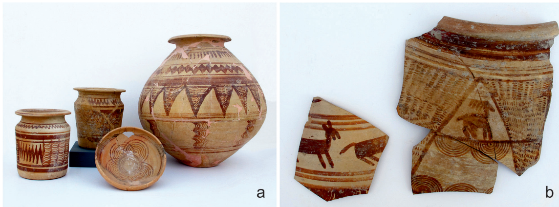
Fig. 2. Cerámica del período ibérico pleno de La Alcudia: a) kalathoi de cuello estrangulado, plato y urna, y b) fragmentos con representaciones de ciervos a tinta plana.

La fase plena está representada en el área contestana que analizamos por La Escuera (San Fulgencio, Alicante) (Abad y Sala, 2001) o La Alcudia, entre otros yacimientos. En este último aparecen por primera vez atestiguados arqueológicamente niveles de hábitat doméstico asociados a contextos materiales típicos de esta época, con platos, cuencos, urnas de cocina, kalathoi de cuello estrangulado, etc. Los vasos mejor conservados, siempre pintados, suelen ser los empleados para contener inhumaciones de neonatos que fueron enterrados dentro de las casas, por debajo de sus pavimentos (Fig. 2a).