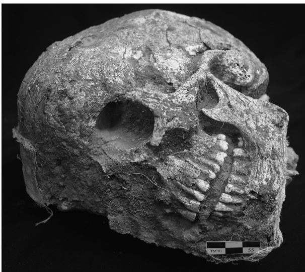
Figura 2: Cráneo del enterramiento n° 55, una vez eliminadas las gasas con consolidante.

Además se realizó un estudio del cráneo del enterramiento 42 (Fig. 2) a través de la tomografía computarizada (TAC), que sin eliminar el engasado con consolidante que lo envolvía permitía estudiar métrica y morfológicamente el cráneo observándolo mediante imágenes de cortes axiales y coronales así como tridimensionalmente.