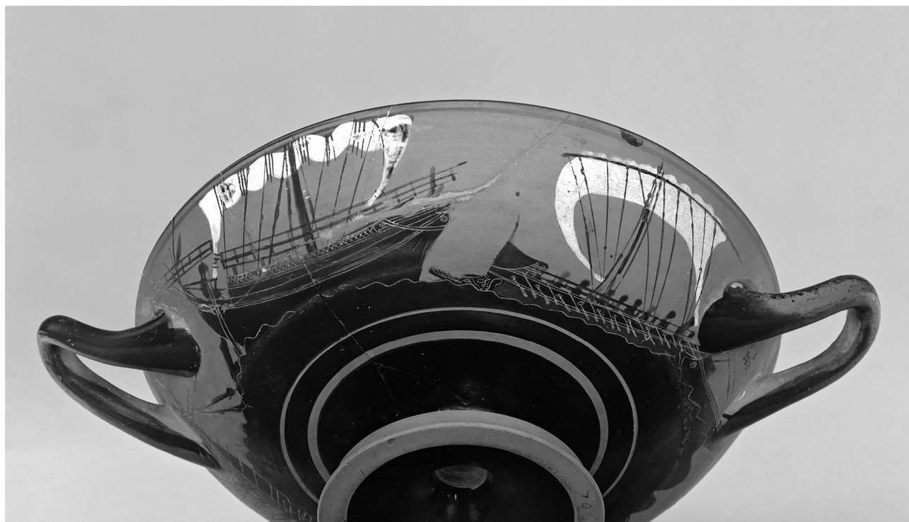
Fig. 1. Kylix de figuras negras con representación de las dos tipologías de barcos (c. 500 a.n.e.) (fuente British Museum)

El tipo de barcos que se empleaban en la navegación comercial eran los llamados “barcos redondos” ( strongyloi ), por contraposición a los “barcos largos” como las birremes y las penteconteras pensados más para la guerra o para viajes de larga distancia (Arribas et al. , 1987: 27) (Fig. 1).