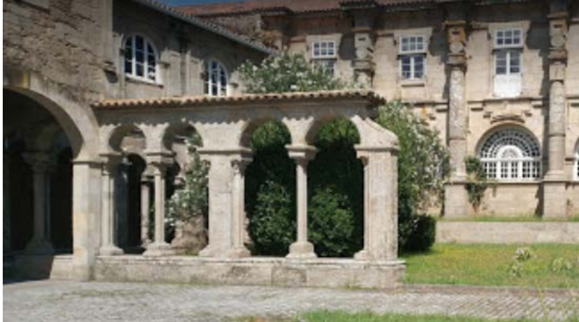
Fotografía 1. Restos del claustro del siglo XII del antiguo Monasterio de Santa María de Conxo.

Se rubricó la cesión del edificio religioso junto todos sus anejos para la fundación de un manicomio de entidad pública y sostenimiento a cargo del Estado mediante Real Orden, del 12 de Mayo de 1862 (Legislación Sanitaria, 1862).