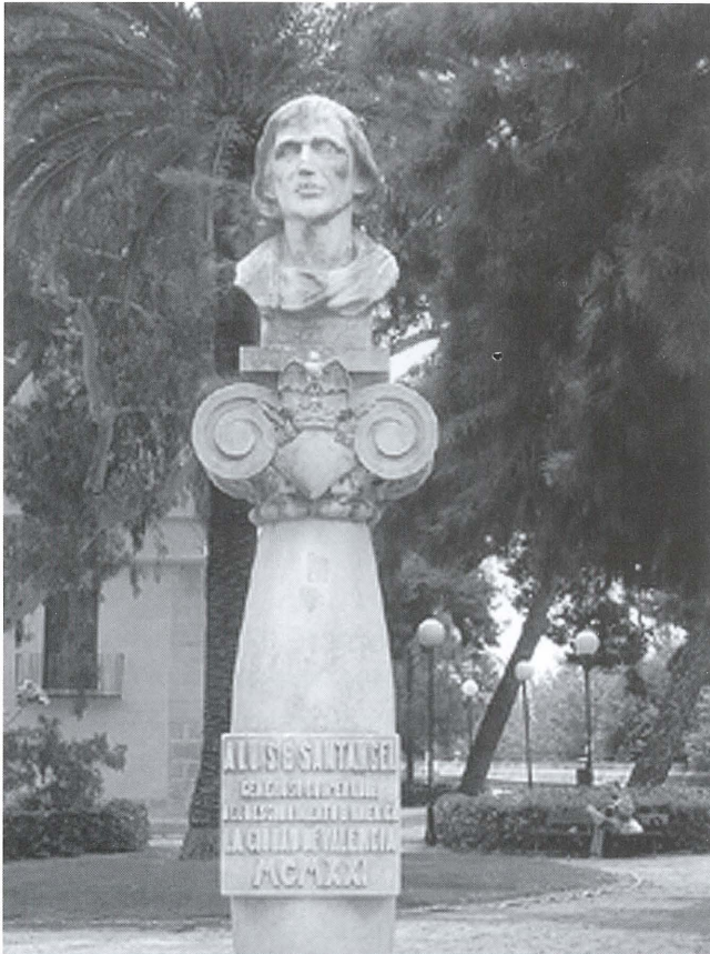
© Josep A. Ferre Puerto, 2009