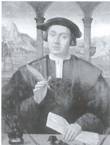
Lluís de Santàngel

Lluís de Santàngel té una especial vinculació amb la Banyeres de finals del segle XV. 2 Del ric fons documental que es conserva a la Catedral de València destaca una ampla sèrie de 8.655 pergamins. Doncs bé, d'aquests únicament dos, els números 5.870 i el 5.871, fan referència a Banyeres de Mariola i casualment els dos ens indiquen les relacions