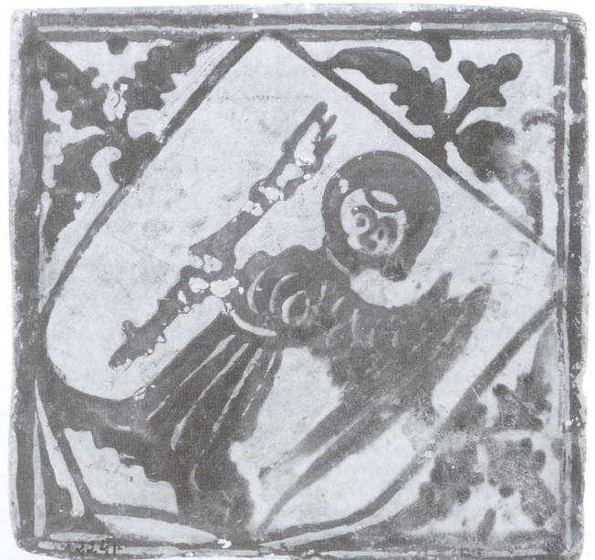
Taulellet amb l'escut dels Santàngel, Museu Nacional de Ceràmica "González Martí", València.

I, com hi hem vist, els veïns de Banyeres foren espectadors i al mateix temps actors d'aquest moment crucial i amb el seu treball, comerciant amb la llana i treballant els camps, els seus estalvis i diners, com el real enconrat a les excavacions a la Torre de la Font Bona anaren més d'una vegada als Santàngel, que finançaren el descobriment del Nou Món. D'això tenim proves documentals, els vells papers i pergamins de fa més de mig mil·lenni i potser un escut en un cantó de la Torre de la Font Bona, que mostra els cognoms del propietari des de fa els mateixos cinc segles.