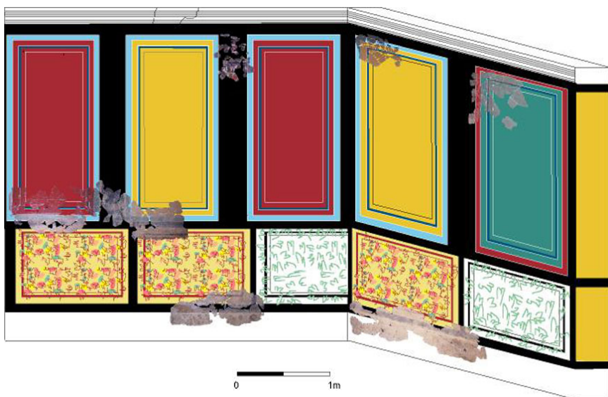
Figura 3: Restitución hipotética de la pintura mural perteneciente a las paredes norte y oeste de la estancia Norte.

En cuanto al significado de esta decoración no podemos tener dudas; no se trata de un mero recurso ornamental, sino que destaca entre uno de sus objetivos principales el de imitar con una gran fidelidad la realidad, pues esta imitación de mármol y de crustae se identifica rápidamente con mármoles reales