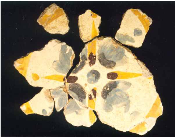
Lámina 8: Flores de pétalos azul-grisáceos insertas en medallones amarillos.

d) Por último, una treintena de fragmentos informes, de medianas, pequeñas y muy pequeñas dimensiones conservan sobre un fondo de color blanco del enlucido superficial la representación de tres flores realizadas mediante cuatro pétalos ( nota 22 ). Éstos, al igual que su punto central o cáliz son de color azul. Su contorno o perfil está repasado por unas pinceladas de color azul oscuro-grisáceo dirigidas al centro de la flor (Lám. 8). Cada intervalo existente entre un pétalo y otro aparece cubierto por una hoja lanceolada en color amarillo, cuyo extremo inferior