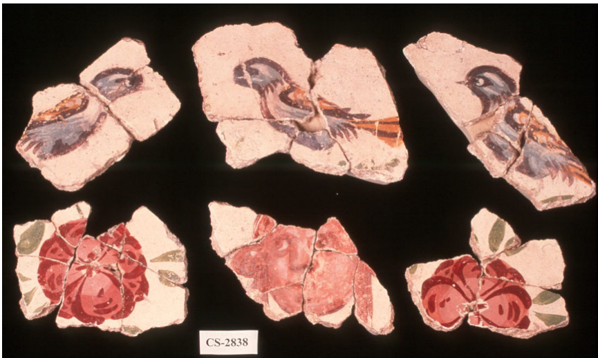
Lámina 9: Imagen de los diferentes motivos decorativos que se representarían en la zona superior de la pared o en el techo.

En cuanto al otro gran grupo decorativo de sistema regular, el que suponemos pertenece a la zona superior de la pared o al techo (Lám. 9), es imposible restituir el dibujo que forma, pues no conservamos ningún fragmento clave que nos ofrezca la unión de los diferentes elementos entre sí. Sin embargo,