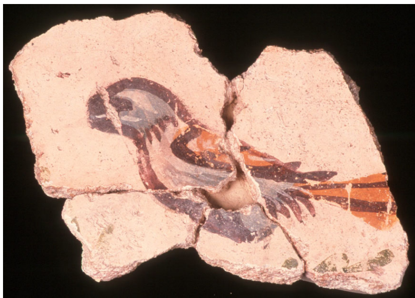
Lámina 5: Pájaros insertos en medallones decorados con imitaciones de dientes de lobo.

hacia la izquierda y el resto hacia la derecha. En dos de los fragmentos hemos podido comprobar cómo bajo todos ellos, y quizás sostenidas por las garras, conservamos en color verde unas ramitas que se asemejan a la forma de las hojas de olivo ( nota 19 ). El estado de conservación de los elementos decorativos es bastante bueno a pesar de haber sido ejecutados con la técnica del temple, gracias a la cual y si observamos detenidamente la capa superficial, apreciamos las pinceladas sueltas y ligeras.