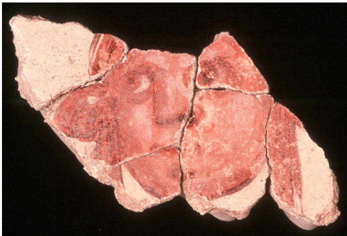
Lámina 7: Representación de máscaras o cabezas lunares.