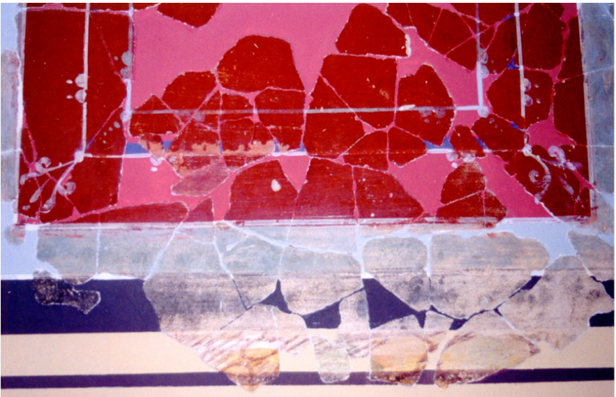
Lámina 3: Elementos decorativos que rodean el perímetro de los paneles anchos de la zona media (nudos en los filetes bícromos y elementos vegetales en las esquinas de los paneles).

Contamos con una gran variedad de filetes dobles y bicromos de encuadramiento interior de los paneles anchos de la zona media: en el panel rojo, conservamos un doble filete blanco-azul oscuro; en los dos campos amarillos que hemos podido distinguir, el encuadramiento es diferente y lo constituyen, por una parte, un doble filete de color blanco-negro y por otra un nuevo doble filete de diferente coloración, en esta ocasión blanco-rojo burdeos; en el panel verde, al igual que en el rojo, el encuadramiento bicromo es el mismo.