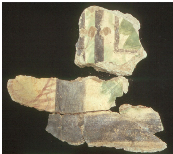
Lámina 1: Esquina de un panel de imitación de mármol cipollino perteneciente al zócalo de la pared norte de la estancia Norte.

marmor caristium , debido a su procedencia de las canteras de Karystos en Grecia, de propiedad imperial. Se extienden alrededor de 60 km a lo largo de la costa suroccidental de la Karystia de Eubea meridional, reagrupada en cinco yacimientos principales entre Styra y Karystos, relacionados con centros urbanos y/o puertos de embarque, algo también frecuente para casi todos los mármoles. Esta procedencia tan lejana encarece aún más la llegada a Hispania de este tipo de mármol, por lo que se recurre a su imitación, que se realiza casi siempre en forma de bloques de medianas y grandes dimensiones.