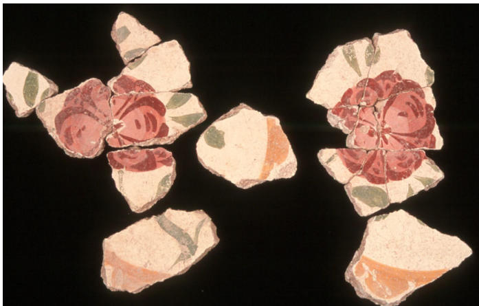
Lámina 6: Medallones amarillos decorados en su interior por una especie de rosas o amapolas.