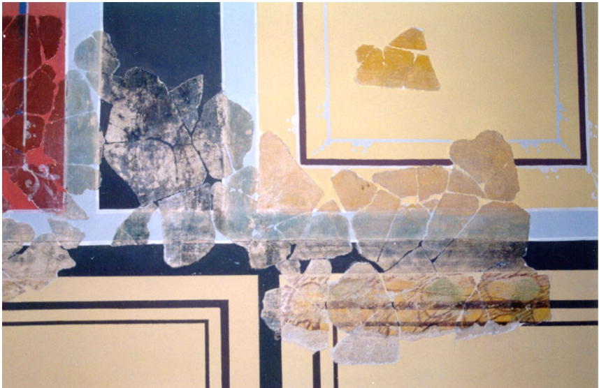
Lámina 2: Imitación de mármol pavnazetto o brocatel en el zócalo conservado de la estancia Norte.

Estilísticamente, la decoración del zócalo que ha llegado hasta nosotros puede emplazarse en la corriente general de sistemas decorativos que presentan imitación de mármol y de crustae marmóreas simples, pues sobre un fondo blanco se colocan los filetes y bandas -listeles- cuyo sentido de lectura indica que éstos deben disponerse en sentido vertical-horizontal, formando un rectángulo de encuadramiento interior y exterior