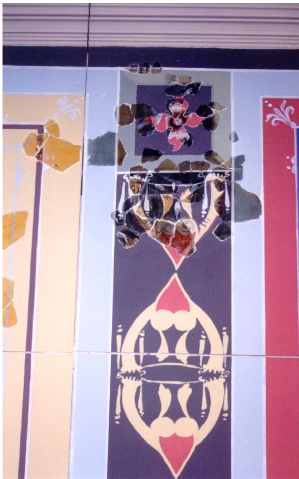
Lámina 4: Interpanel con decoración de candelabro compuesto por cornucopias dobles e invertidas y motivos vegetales, todo ello coronado por una flor dentro de un casetón.