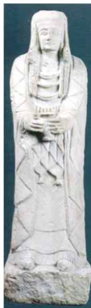
Gran Dama del Cerro de los Santos (Albacete) conservada en el M.A.N.

Bàsicament es feia una crítica a la restauració de la Dama de Guardamar argüint que s'havia buscat fer una còpia de la Dama d'Elx. Sent becària del Museu Arqueològic d'Alacant vaig tindre la sort d'ajudar al restaurador, Vicent Bernabeu, a registrar gràficament el procés de