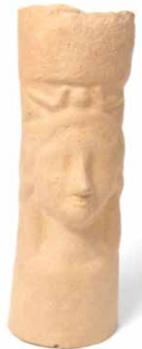
Santuari territorial Castell de Guardamar