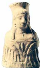
Cova d'es Culleram Eivissa