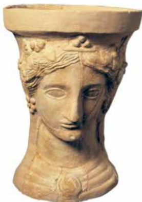
Temple urbà El Campello