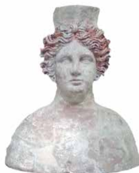
Puig d'es Molins Eivissa