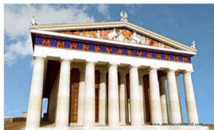
Restitució del pòrtic del Partenó

Portada del catàleg de l'exposició El color de los dioses amb el conegut arquer del frontó del temple de Afaia en Egina