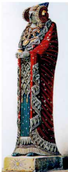
Proposta d'alguns investigadors recollida en l'actual exposició del M.A.N.

L'escultura i el peveter coincideixen en el tipus escultòric, el bust de ple volum, i la figuració es concentra en el cap i part superior del cos, ja que l'essencial són el rostre i els ornaments del personatge representat. Estan realitzades per a ser vistes únicament de front, tot i que es treballa el volum sencer. Els historiadors de l'art dirien que el punt de vista de ambdues peces es unifacial. Els arqueòlegs diríem que, ja des de l'època sumèria en el tercer mil·lenni aC, el punt de vista frontal propicia que el feligrès s'aproxime a la divinitat amb submissió i és una senyal de respecte. Des de la presentació de l'escultura de la Dama en alguns cercles científics s'enceta una polèmica a propòsit del tipus escultòric: era un bust o una figura dempeus?. En l'origen del debat estan, d'una banda, les circumstàncies de la troballa, recordem que va ser trobada en l'estrat superficial, fora del seu lloc original, trencada i incompleta; d'altra banda, l'opinió d'un grup d'investigadors que en aquells anys defenien que la Dama d'Elx podia ser una escultura en peu, com la Dama del Cerro de los Santos (Albacete), i que va ser trencada pel pit en el moment de la seua ocultació.