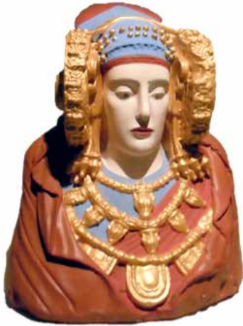
Recreació de l'aspecte original de la Dama d'Elx a partir de les restes de pigments