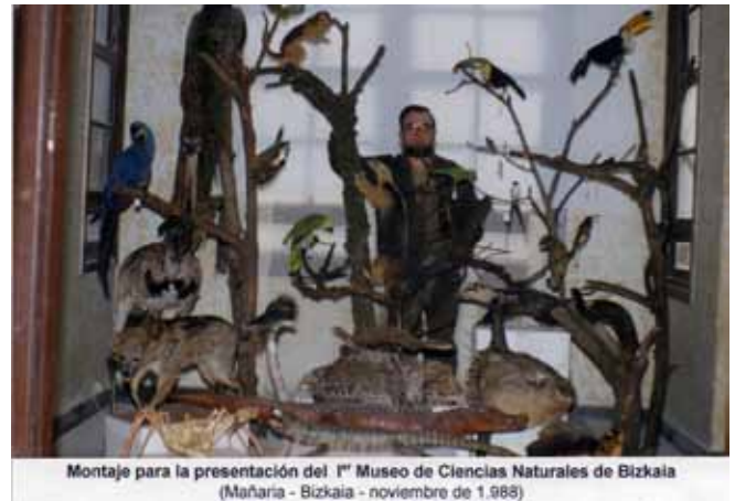
Montaje para la presentación del 1º Museo de Ciencias Naturales de Bizkaia (Mañaria - Bizkaia - noviembre de 1.985)

Este tiempo expositivo duró un tiempo de tres años y medio, más o menos, desde Junio de 1987 a Diciembre de 1990, oficialmente, ya que siguió atendiendo a los colegios que estaban concertados, hasta marzo del 91.