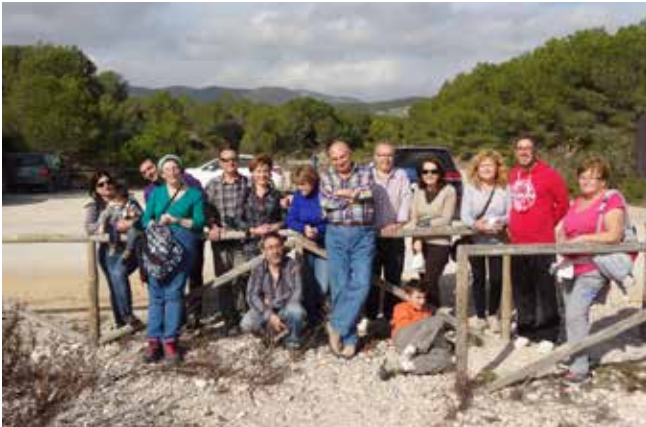
Días 6 y 7 de febrero de 2016, visitamos Peñíscola, pasando un muy agradable fin de semana.