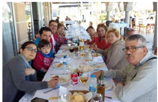
Día 2 de abril La Manga.