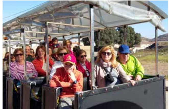
Día 26 de marzo, visitamos La Unión.