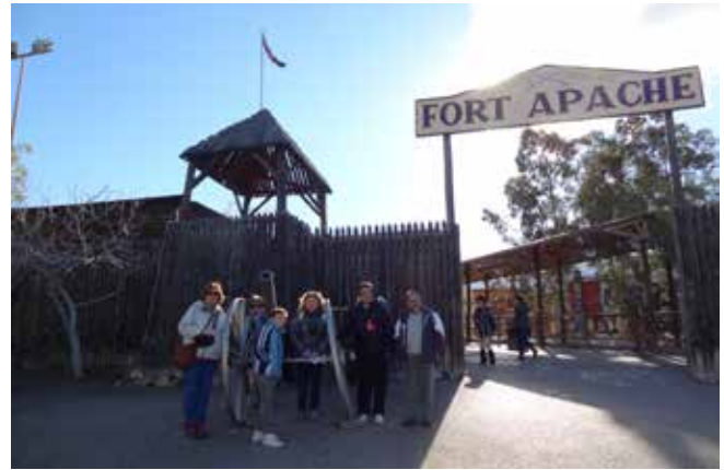
Días 5 y 6 de marzo de 2016, otra bonita salida a tierras andaluzas.