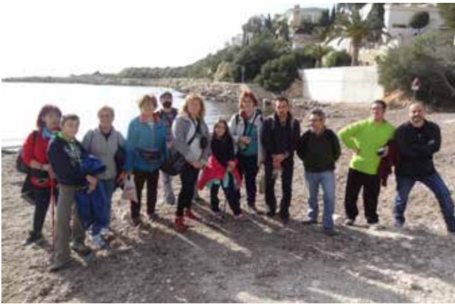
Día 3 de enero de 2016, visitamos El Campeño.