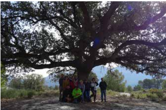
Día 21 de febrero, visita a Tollos.